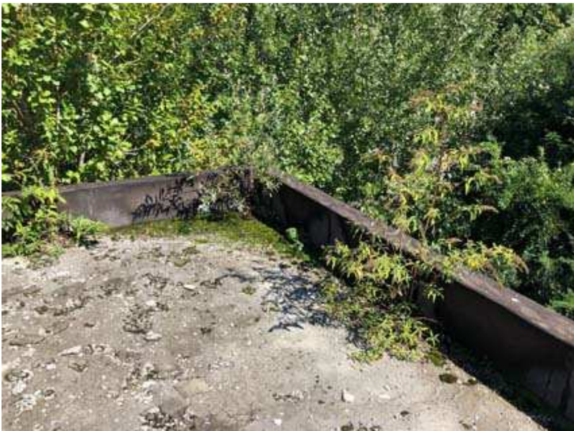
14. Vista particolare di copertura