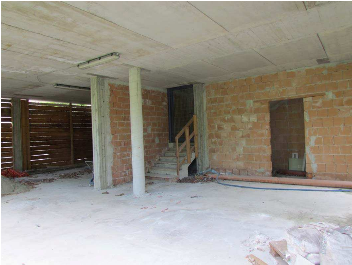
7. Vista interna con scala di accesso al piano primo