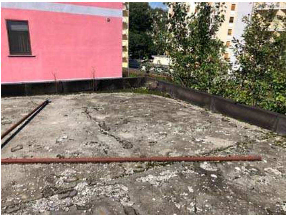
16. Vista manto di copertura attuale