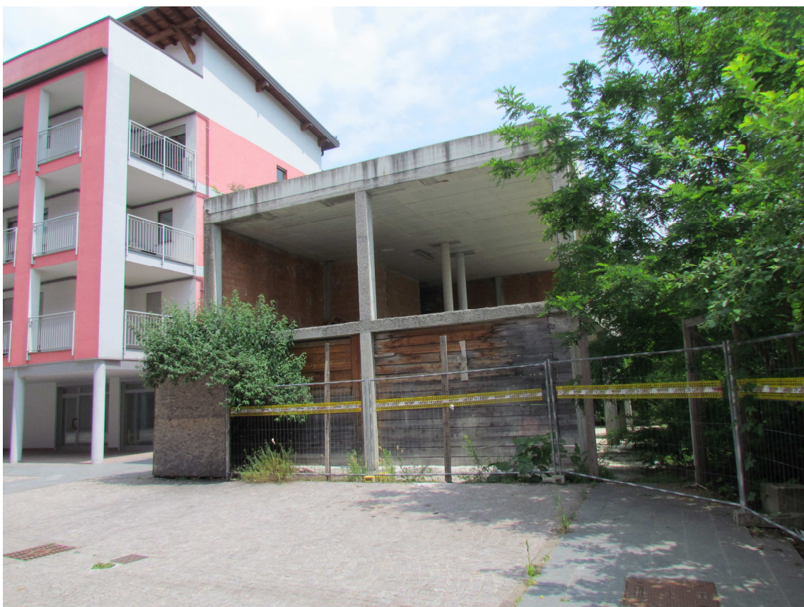
5. La Biblioteca, la Piazza, gli edifici residenziali