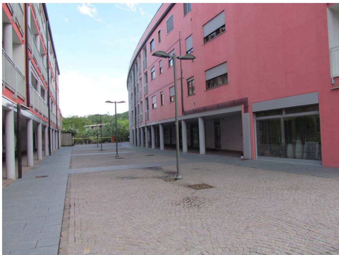
6. Piazza tra edifici centrali con Biblioteca sullo sfondo a sinistra