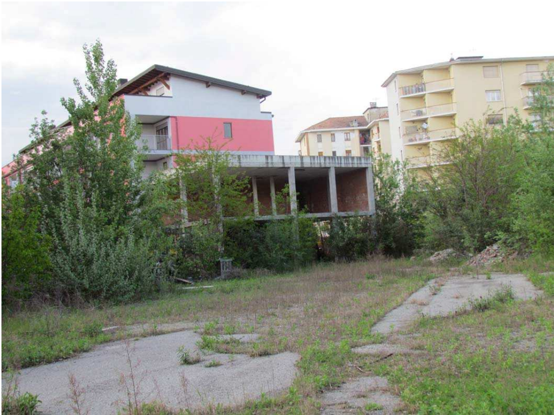
3. Vista d'insieme da sud-est