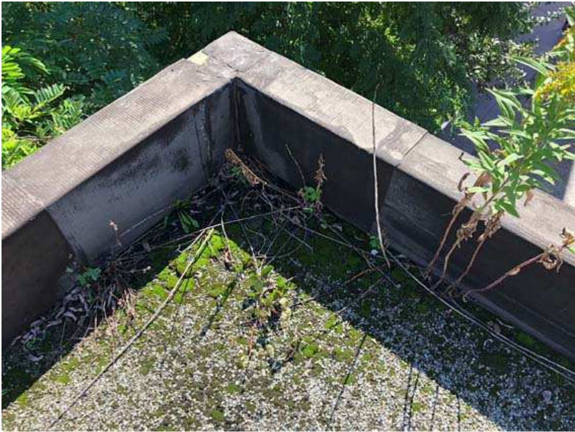
13. Vista particolare di copertura