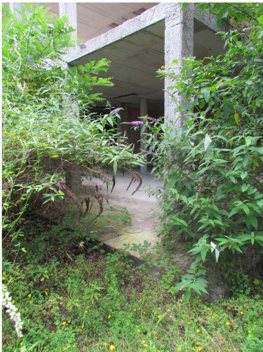
17. Vista della struttura e del piano finito di fondazione