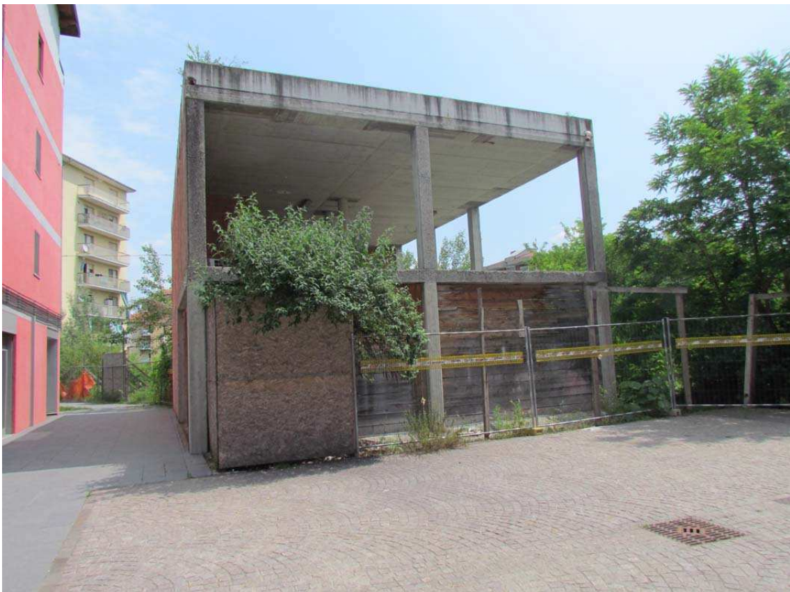
4. La Biblioteca e la Piazza