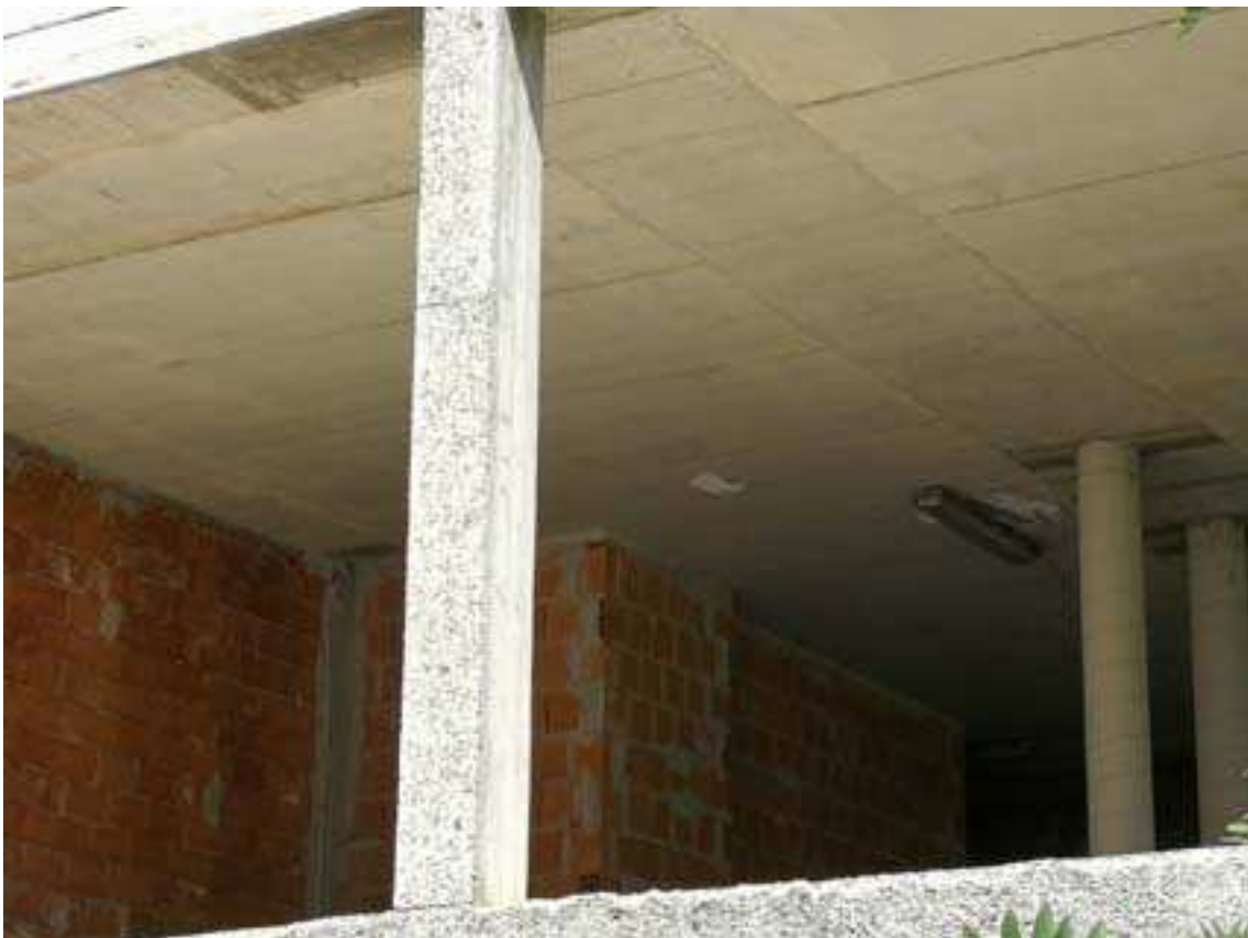
10. Vista interna