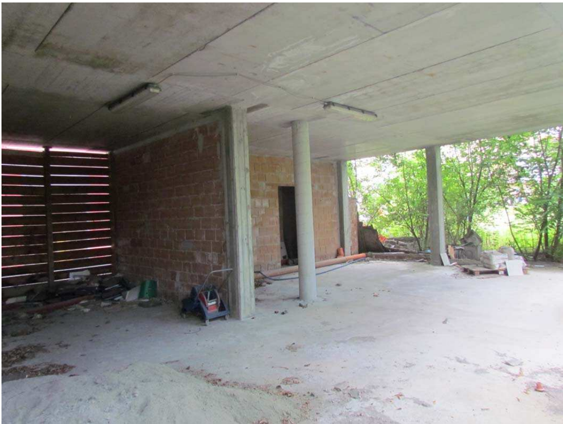
8. Vista interna