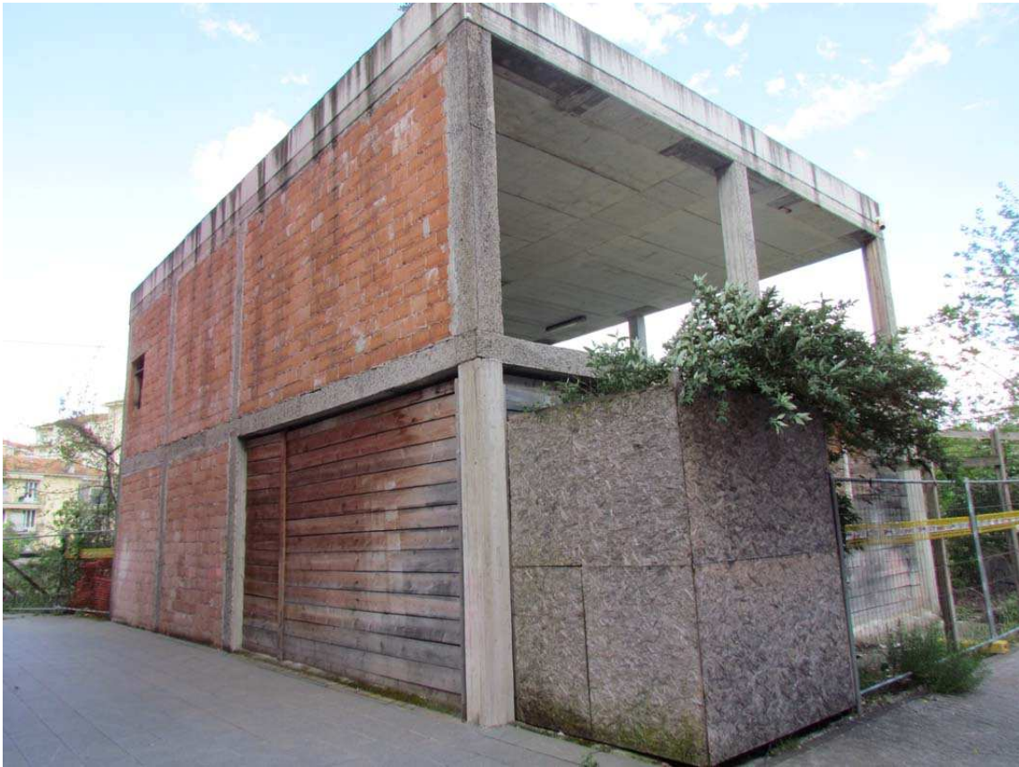
1. La Biblioteca al rustico vista da sud-ovest