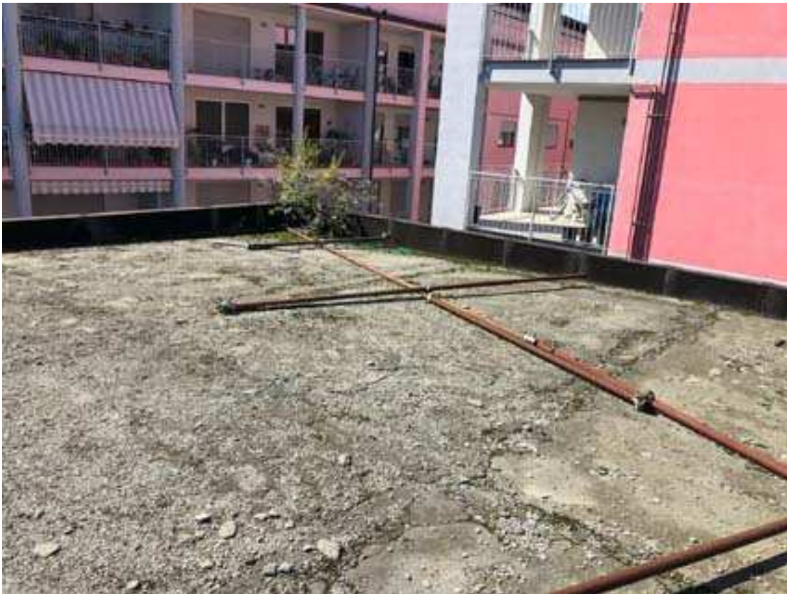
11. Vista della copertura attuale