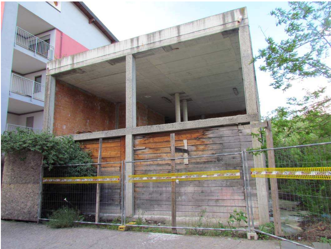
2. La Biblioteca al rustico vista da sud-est