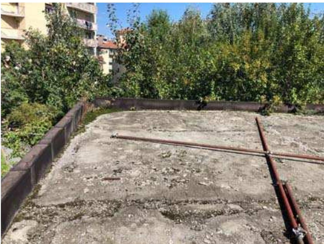
12. Vista particolare di copertura