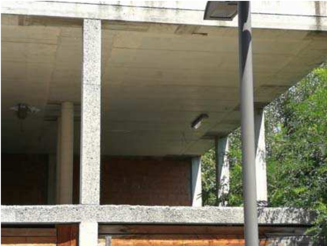
9. Vista interna