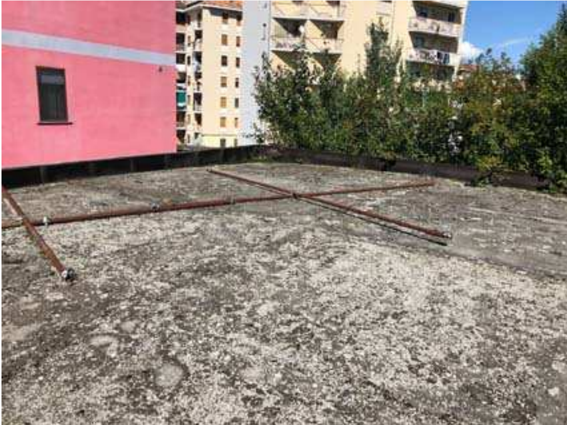
15. Vista del manto di copertura attuale