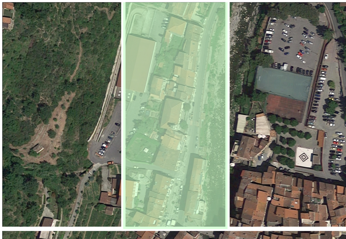
Estratto dalla Vista Aerea