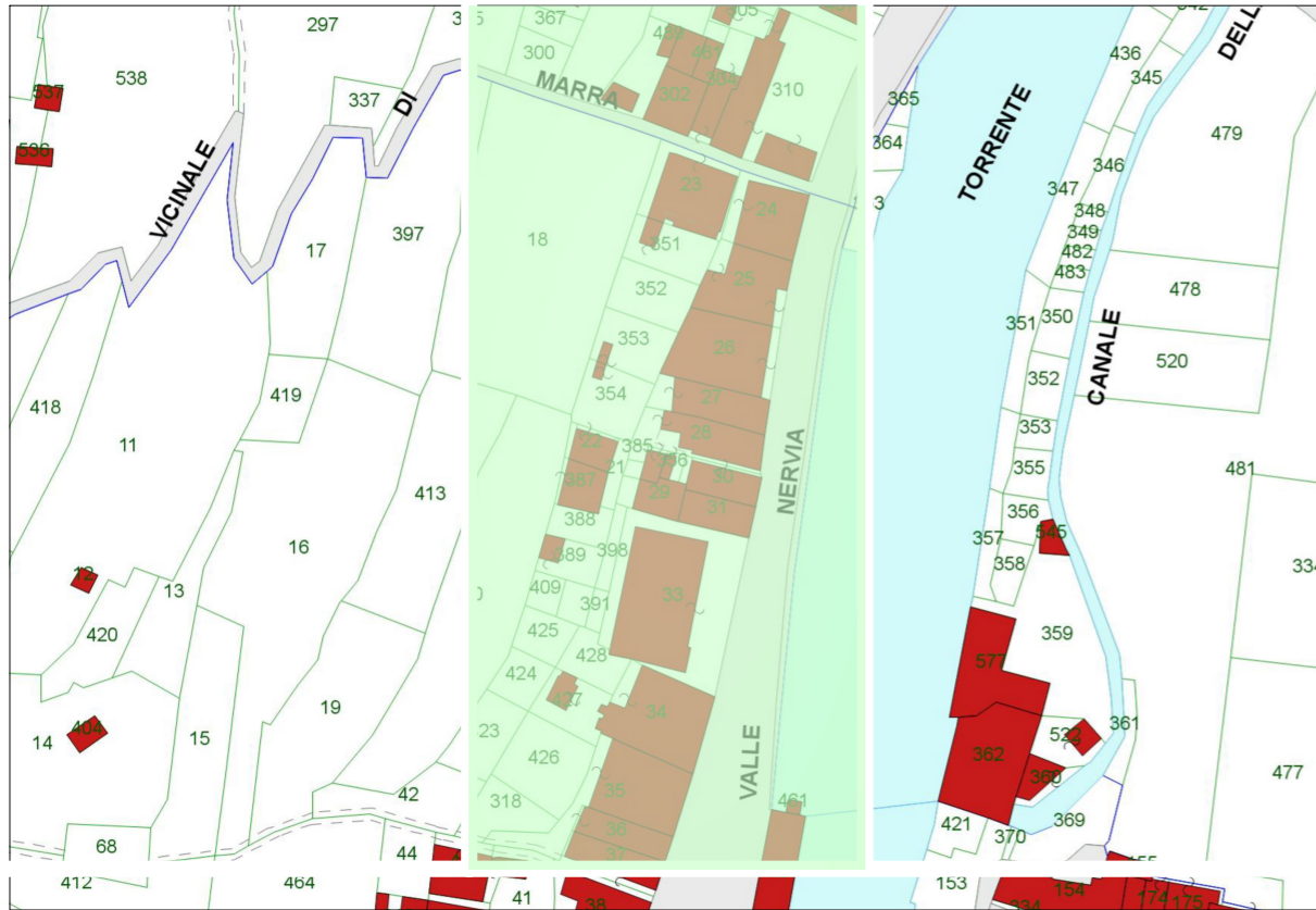
Estratto dalla Mappa Catastale: Foglio 16 Particella 33