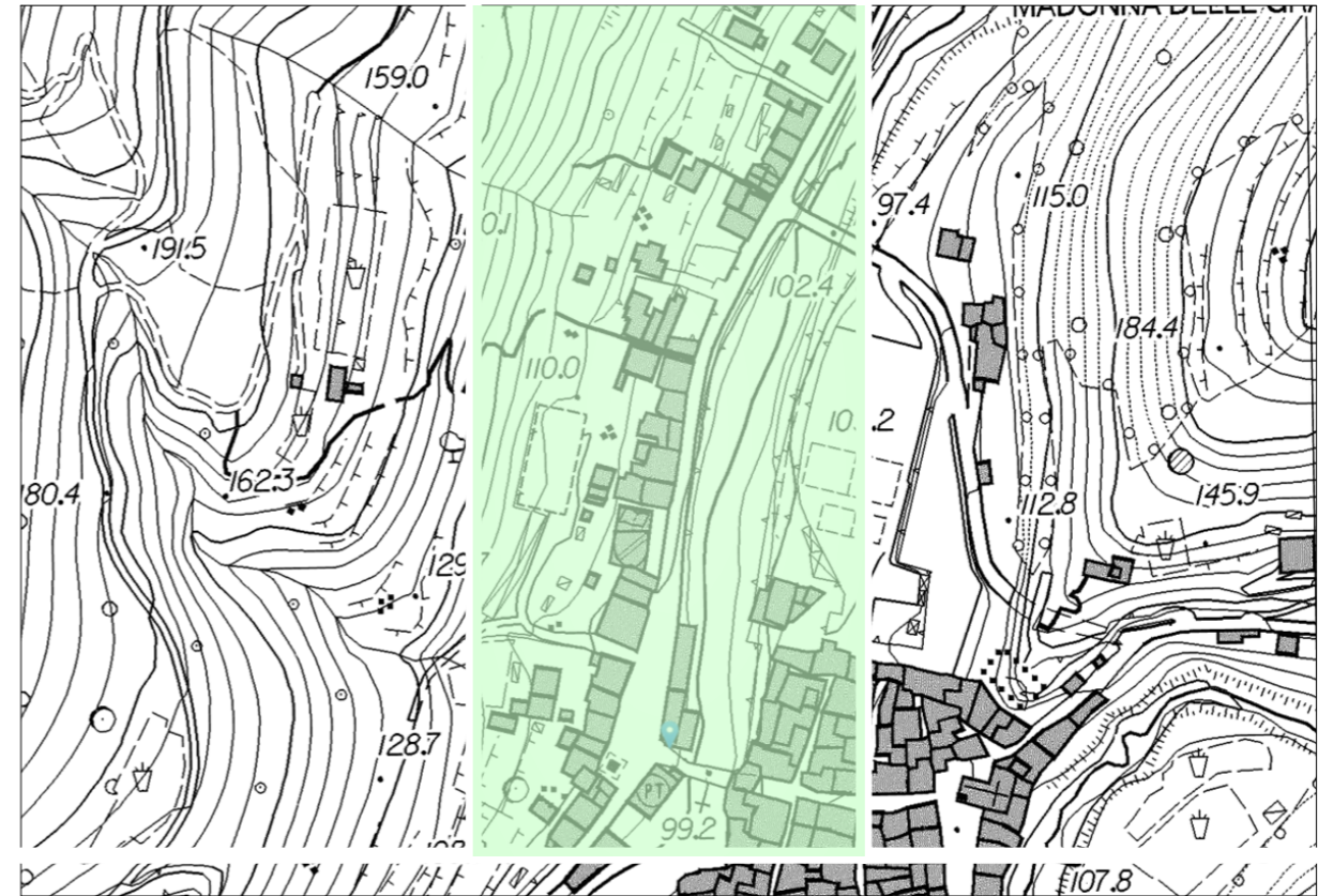
Estratto dalla Carta Tecnica Regionale