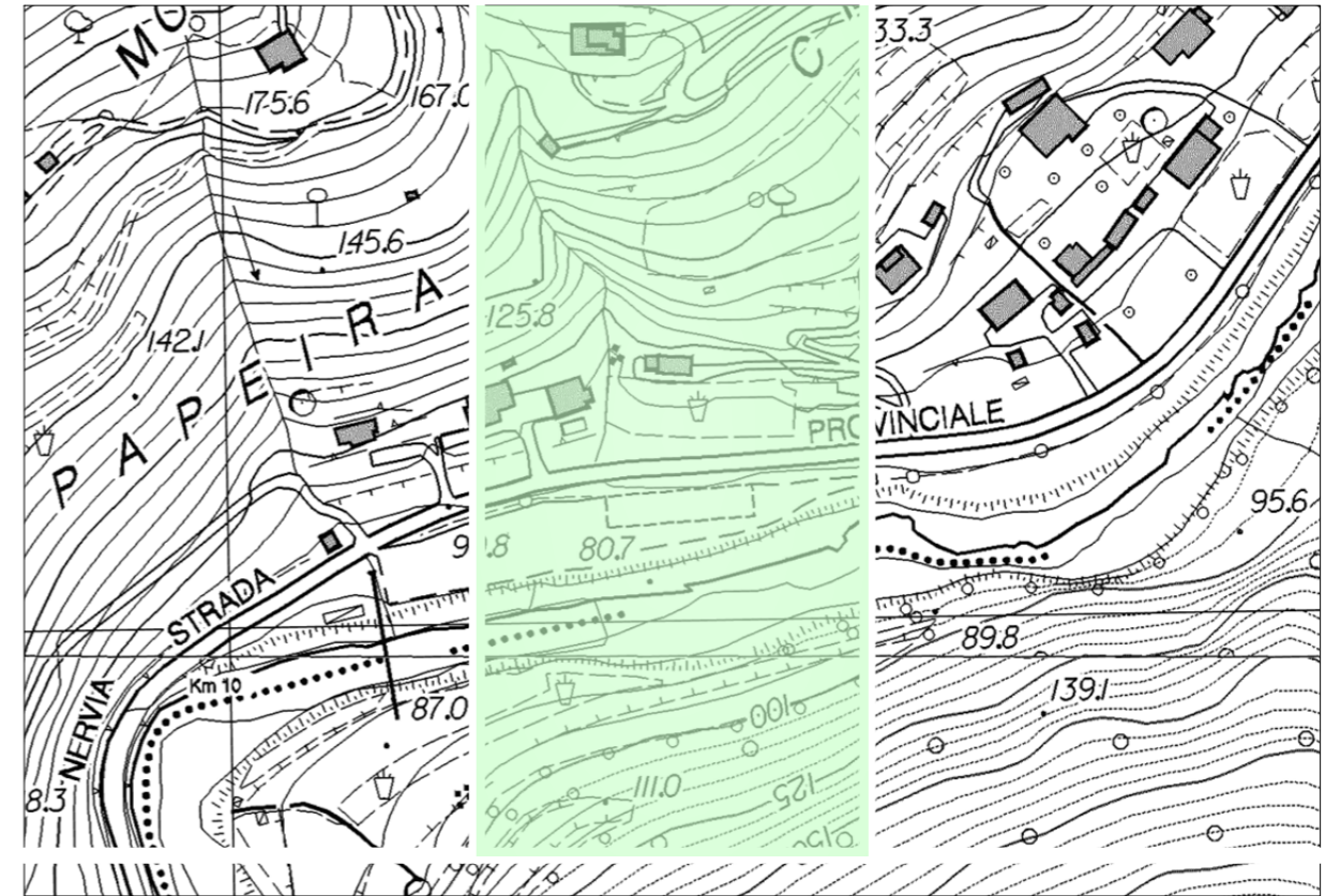
Estratto dalla Carta Tecnica Regionale