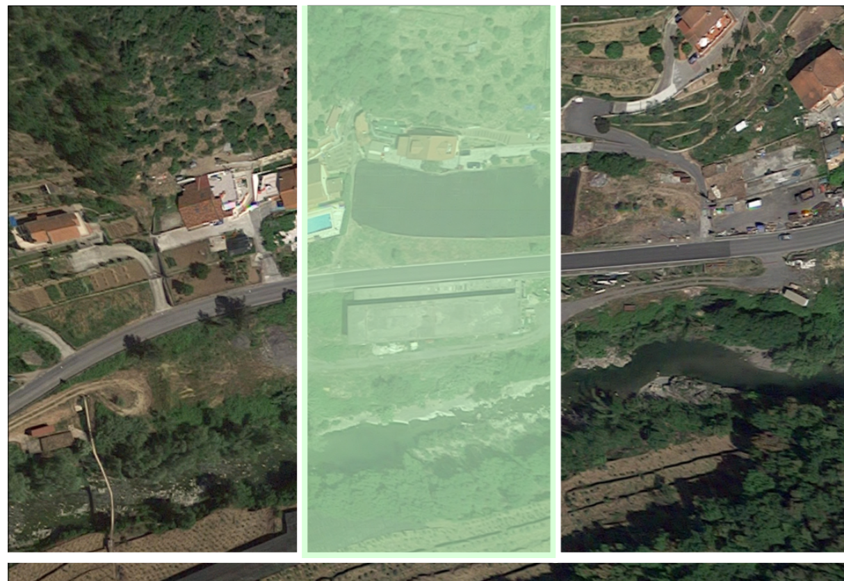
Estratto dalla Vista Aerea