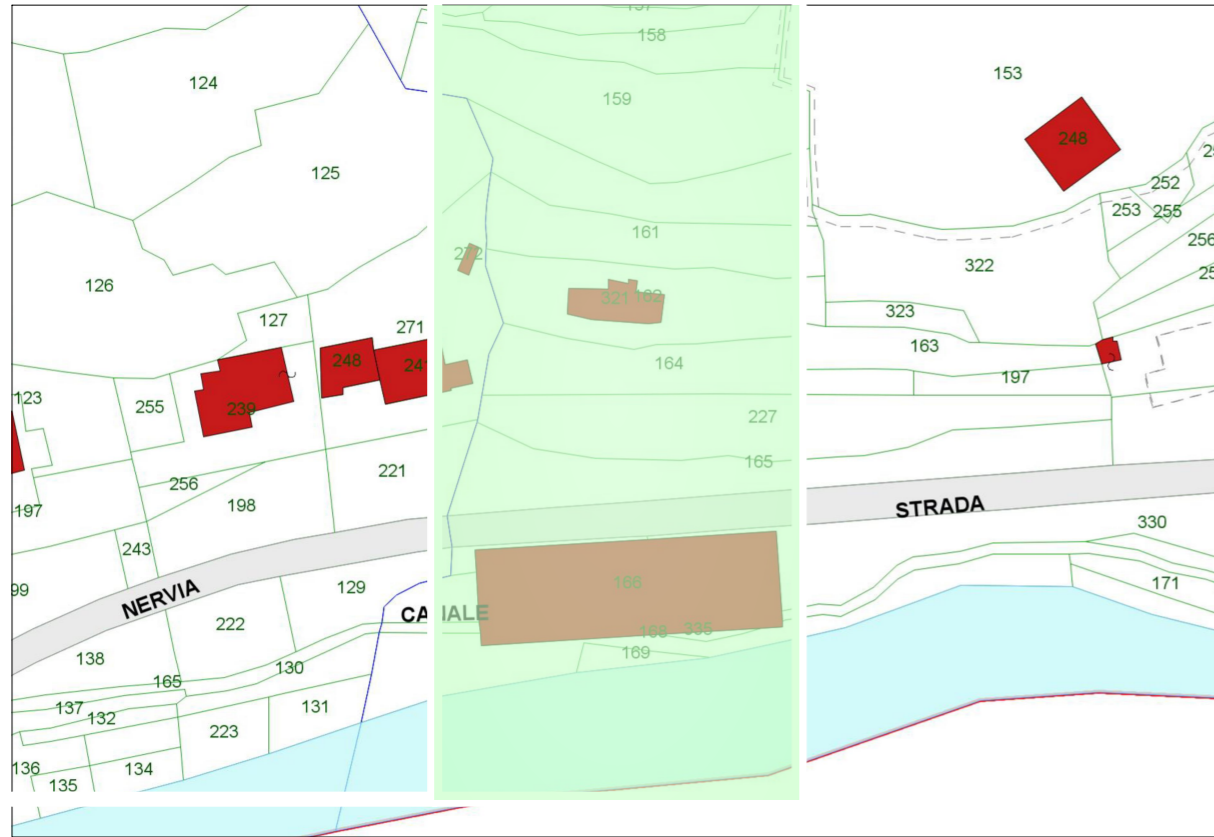
Estratto dalla Mappa Catastale: Foglio 15 Particella 166