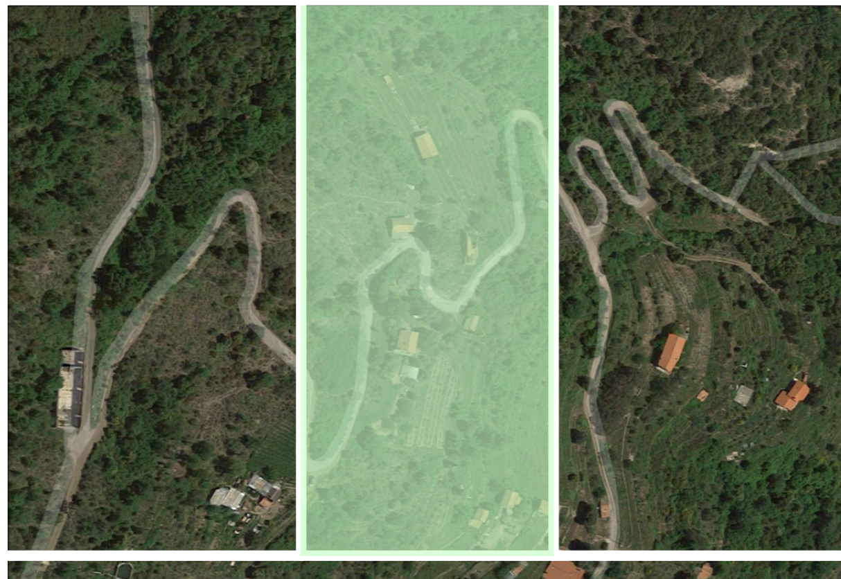
Estratto dalla Vista Aerea