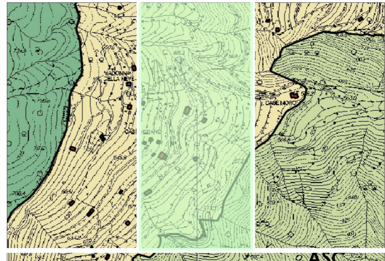
Estratto dal Piano Urbanistico Comunale