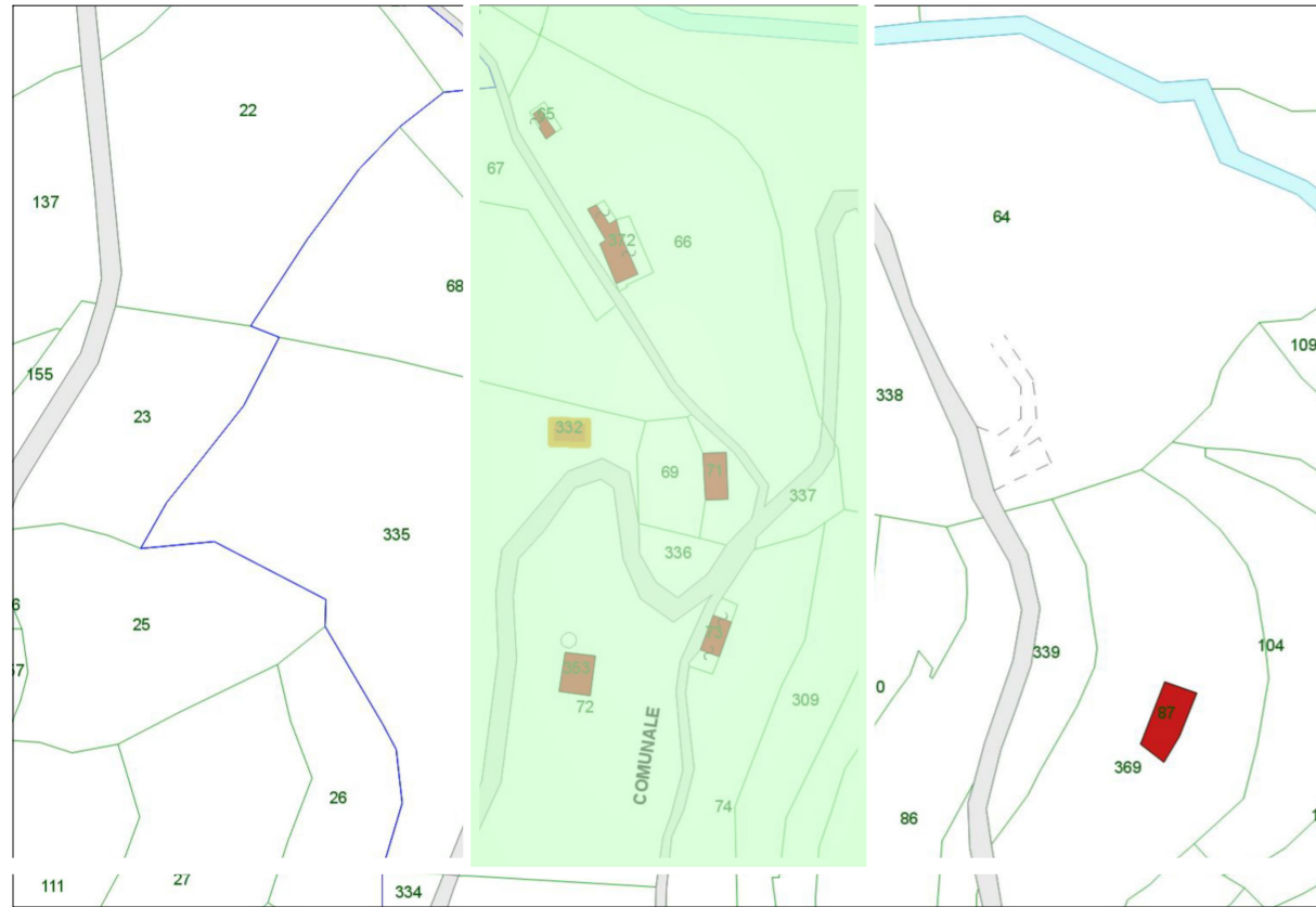
Estratto dalla Mappa Catastale