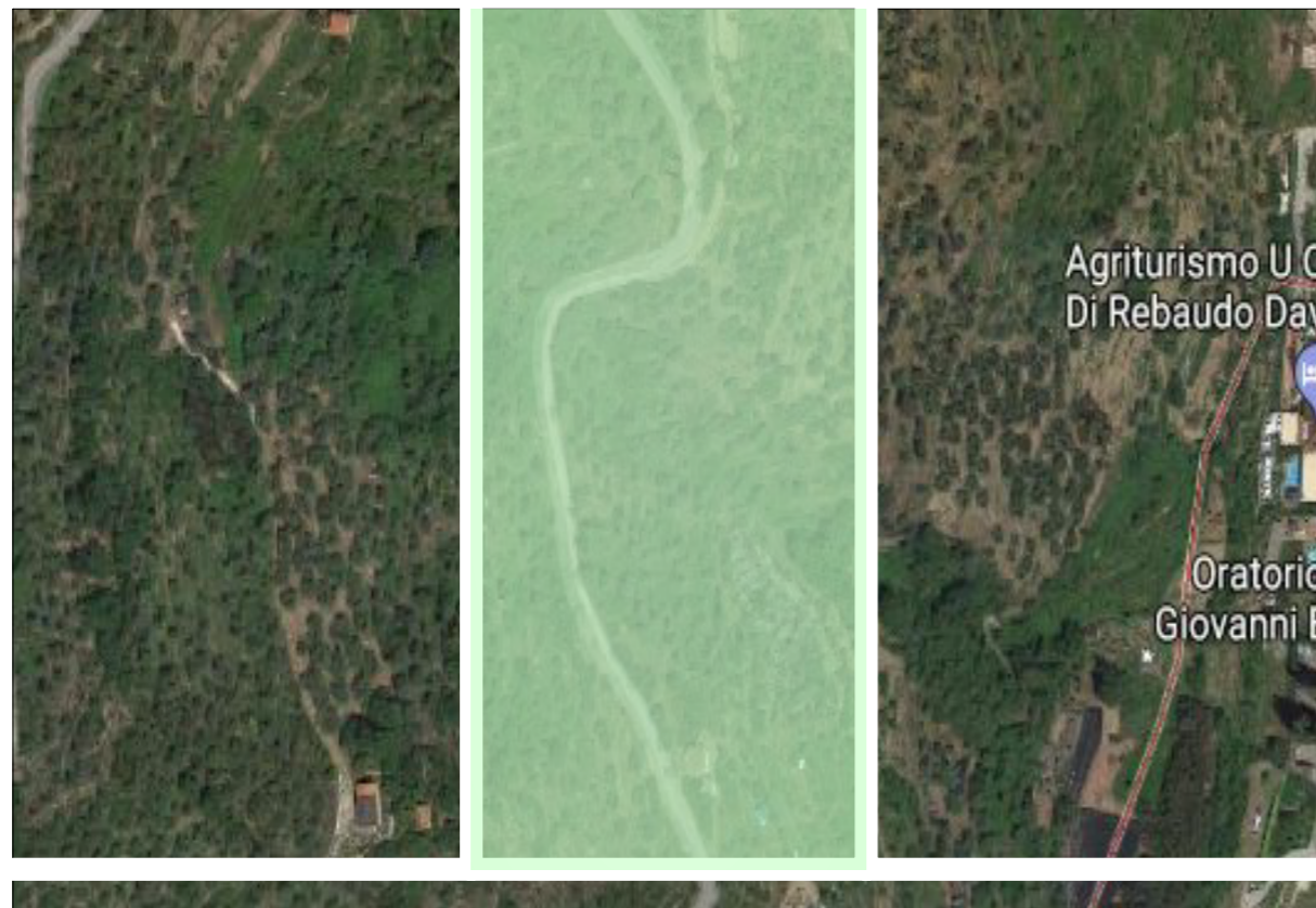
Estratto dalla Vista Aerea