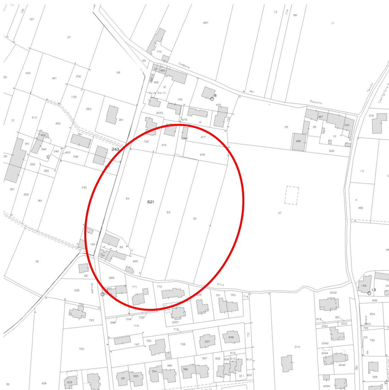
Estratto catastale Comune di Busca (foglio 57 map. 64-621-63-32)