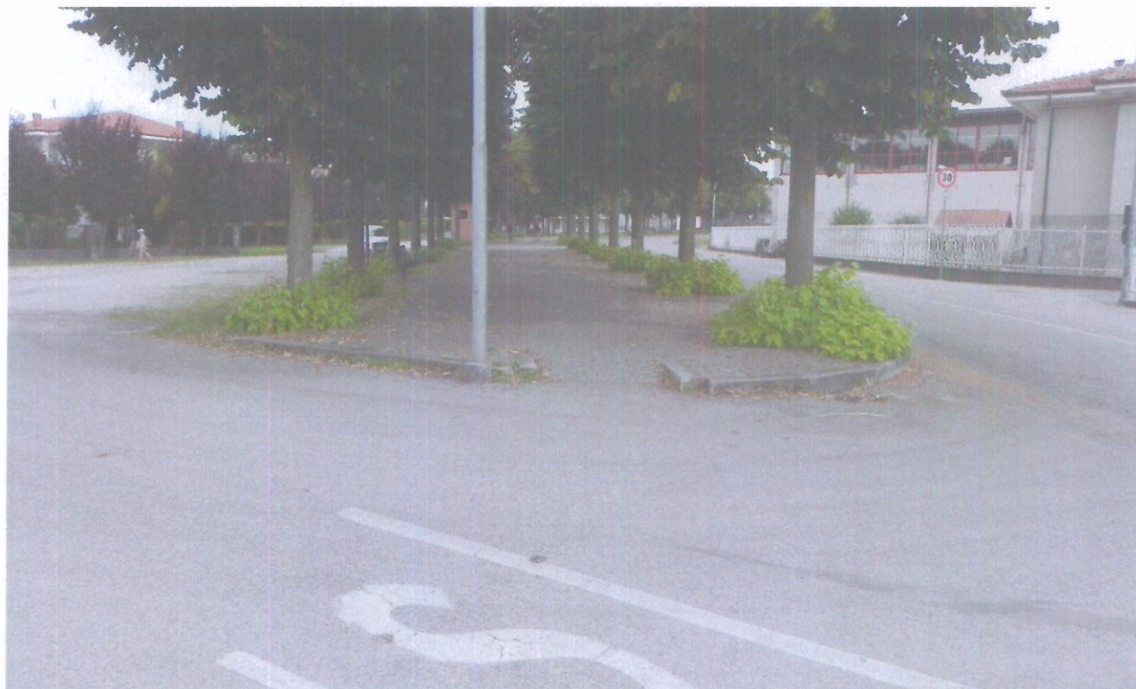
foto 10 - Panoramica sull'incrocio di Via Ferrero con Viale Monte Ollero