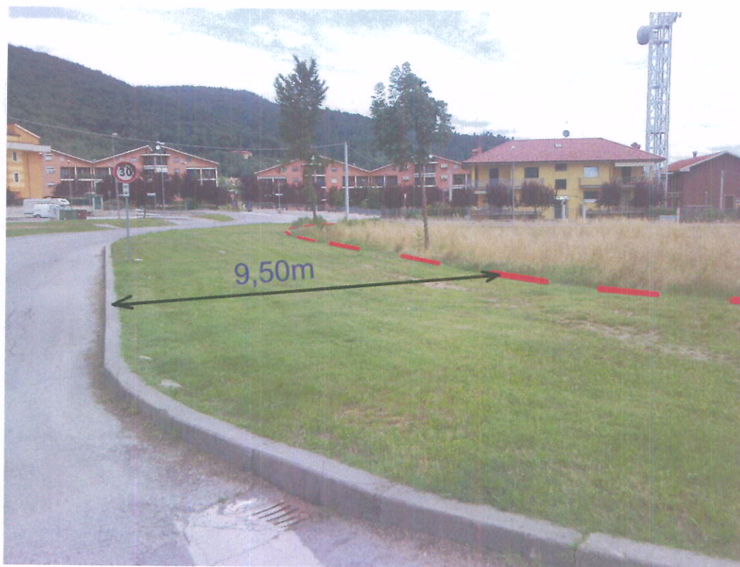
foto 15 - Vista verso Nord di via Monte Ollero con la linea di riconfinamento in primo piano