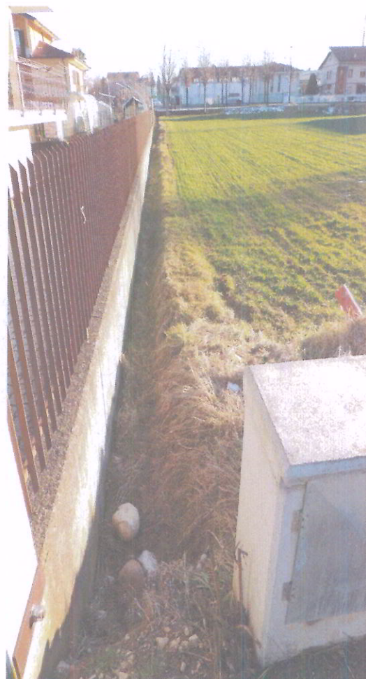
foto 4 - lato Est - recinzione