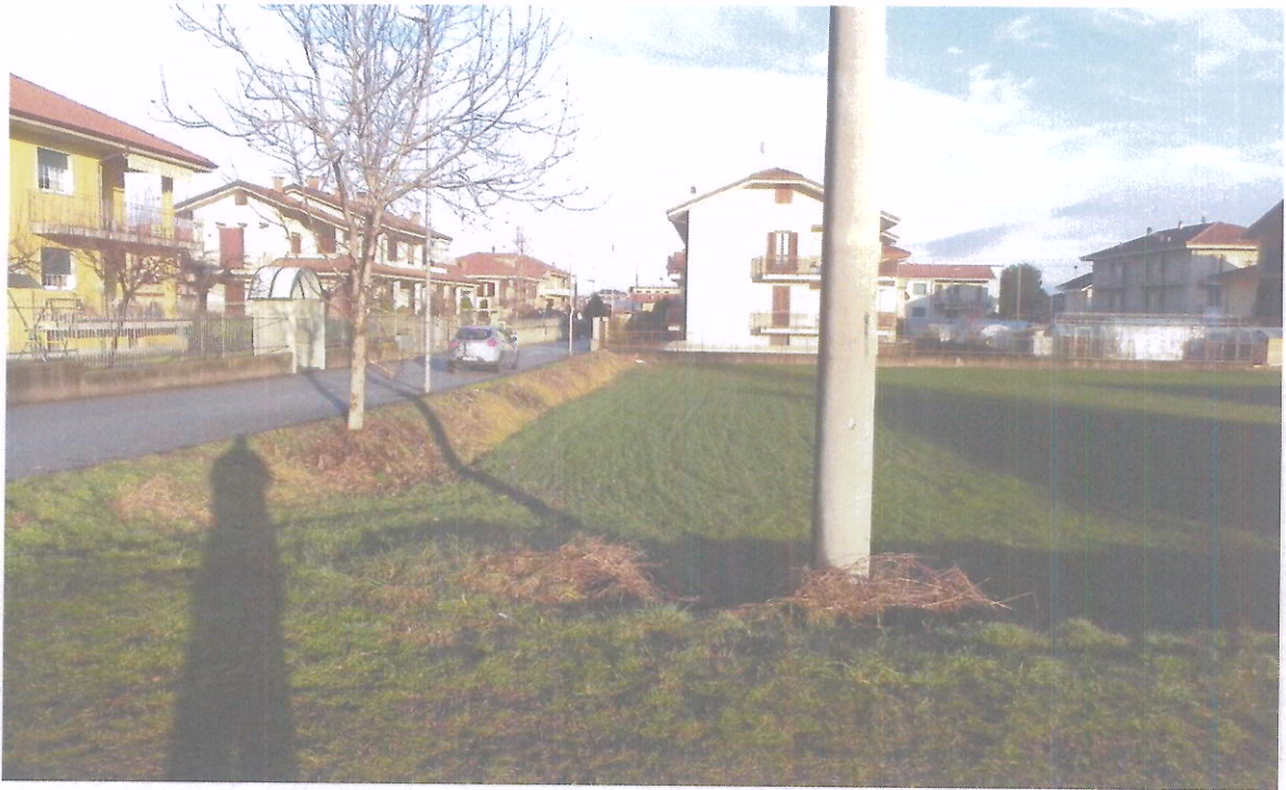
foto 6 - Panoramica di Via Giotto