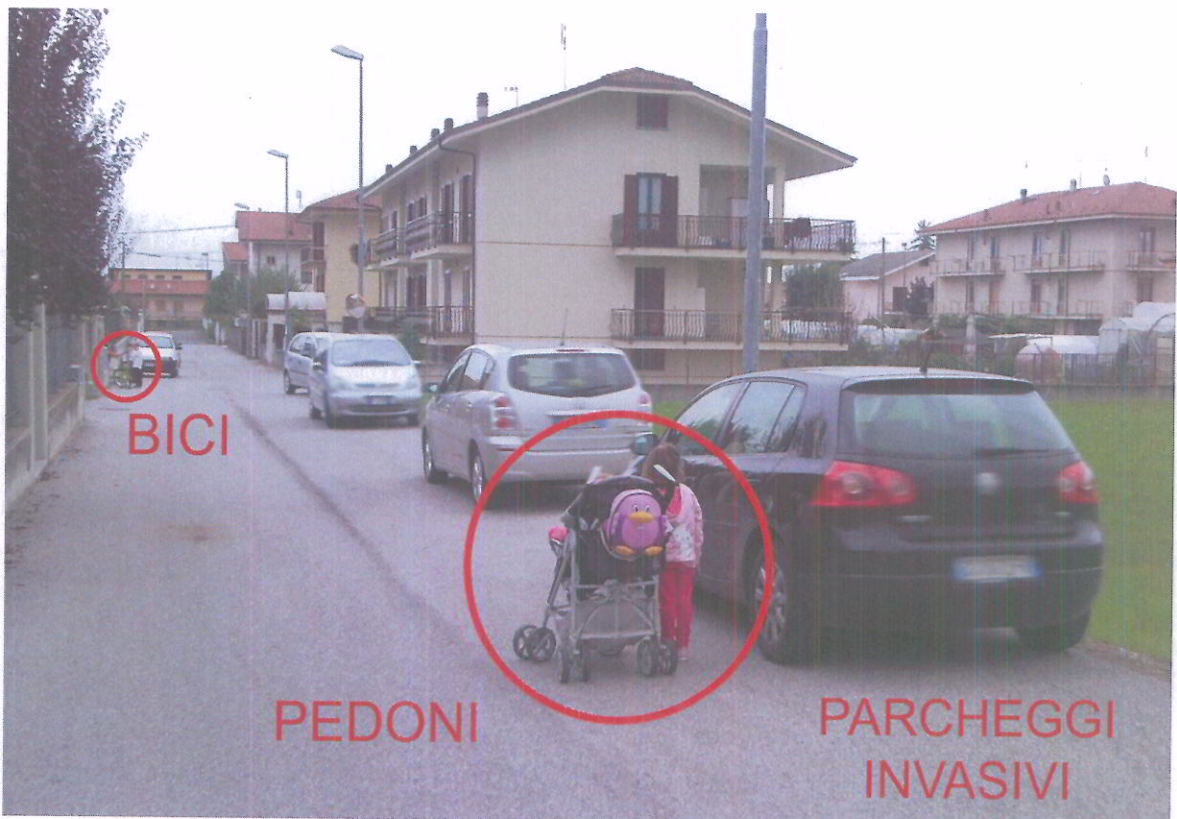
foto 7 - particolare su Via Giotto: attuale criticità della viabilità