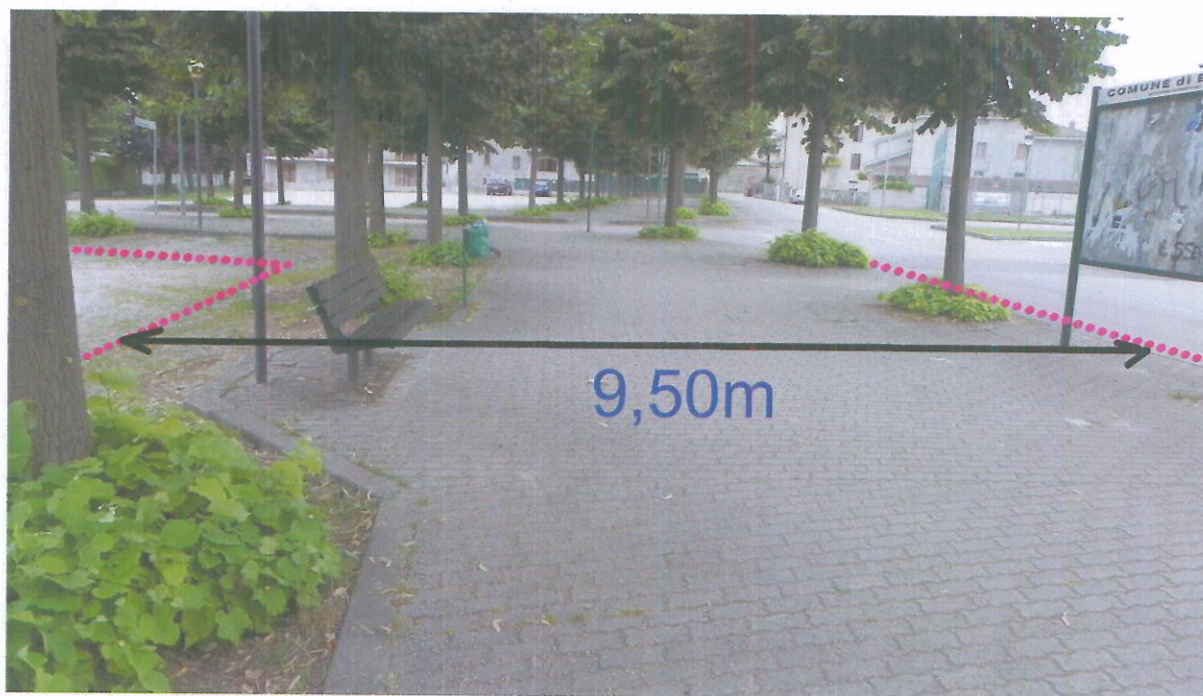
foto 9 - Panoramica del Viale Monte Ollero con indicazione della larghezza di ingombro del viale esistente