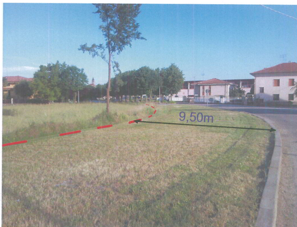
foto 13 - Vista verso Sud di via Monte Ollero con la linea di riconfinamento in primo piano