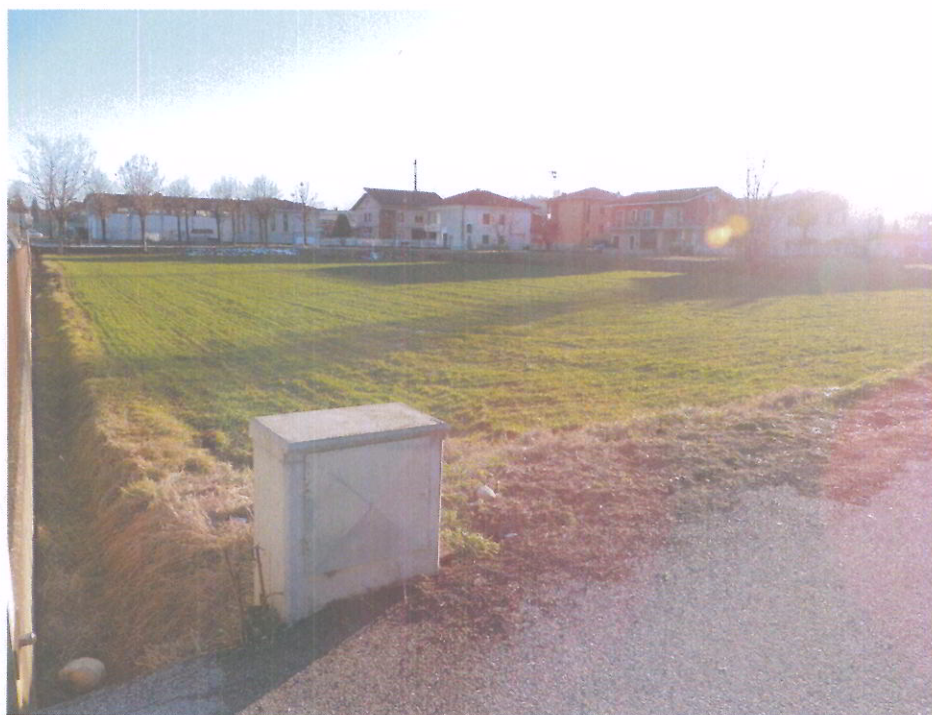
foto 5 - Panoramica dell'area di intervento con scarpata esistente in prossimità dell'incrocio tra Via Ferrero e Via Monte Ollero