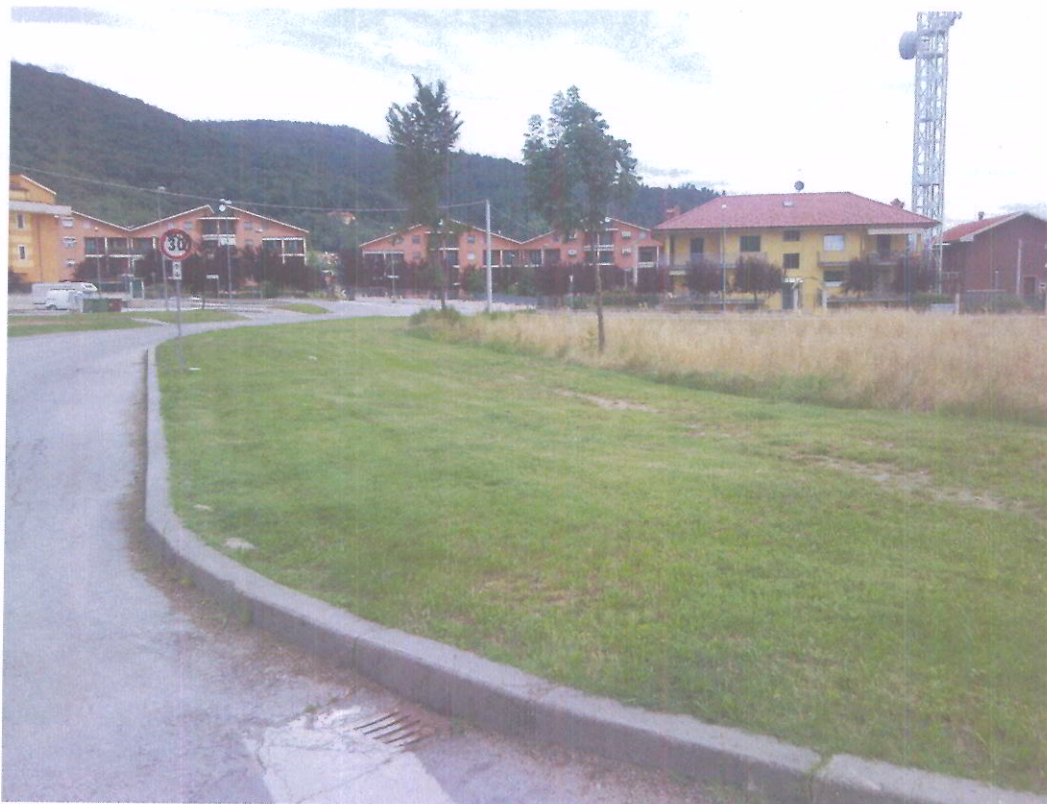
foto 14 - Vista verso Nord di via Monte Ollero; in primo piano il tratto di pertinenza del futuro Viale alberato