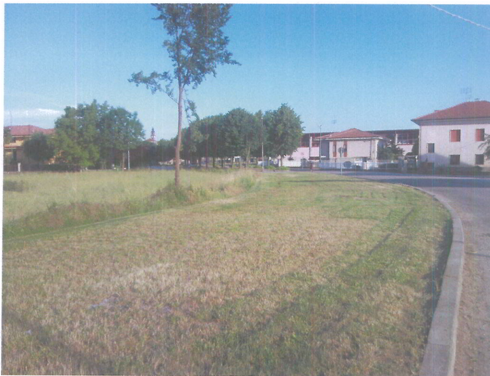
foto 12 - Vista verso Sud di via Monte Ollero; in primo piano il tratto di pertinenza del futuro Viale alberato