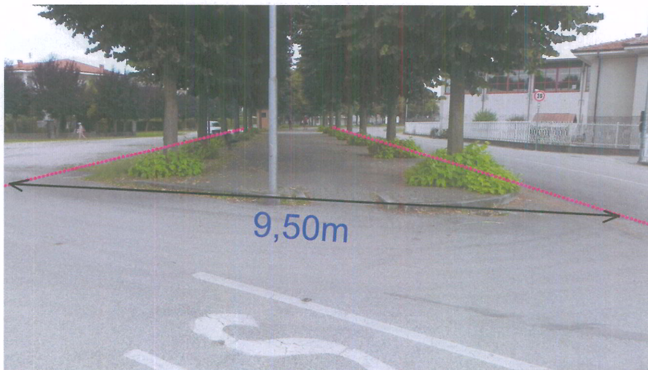
foto 11 - Panoramica sull'incrocio di Via Ferrero con Viale Monte Ollero con indicazione della larghezza di occupazione del viale esistente