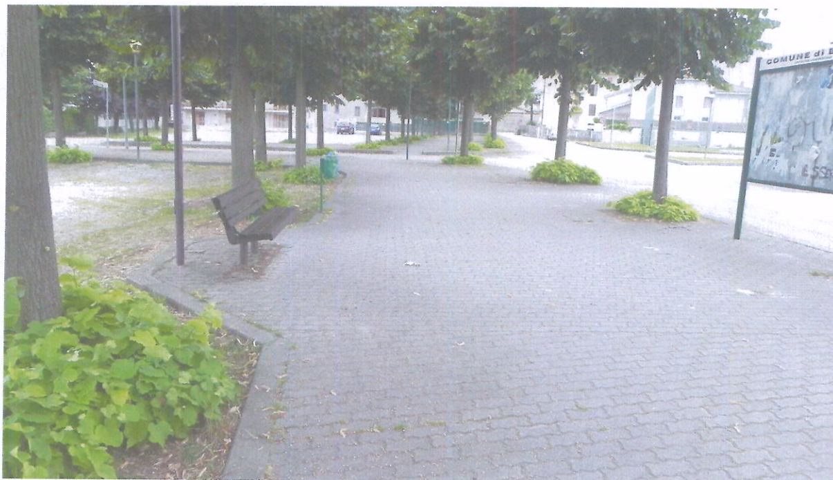
foto 8 - Panoramica del Viale Monte Ollero con panchina