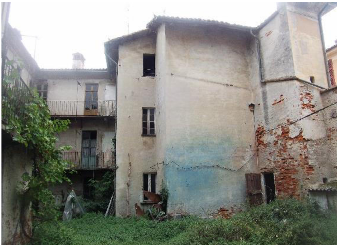
FIGURA 11 VISTA FOTOGRAFICA 9 (VERSO INTERNO CORTILE)