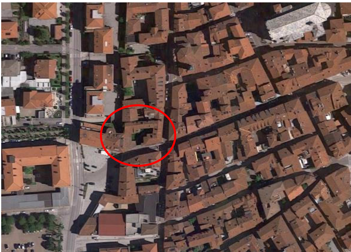
FIGURA 2 ORTOFOTO