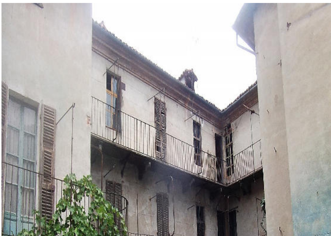
FIGURA 9 VISTA FOTOGRAFICA 7 (VERSO INTERNO CORTILE)