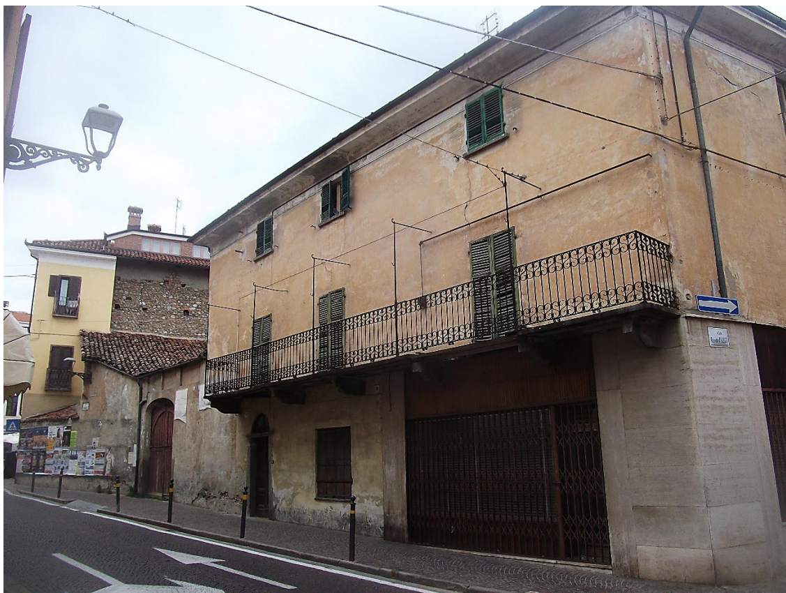
FIGURA 4 VISTA FOTOGRAFICA 3 (VERSO VIA UMBERTO I)