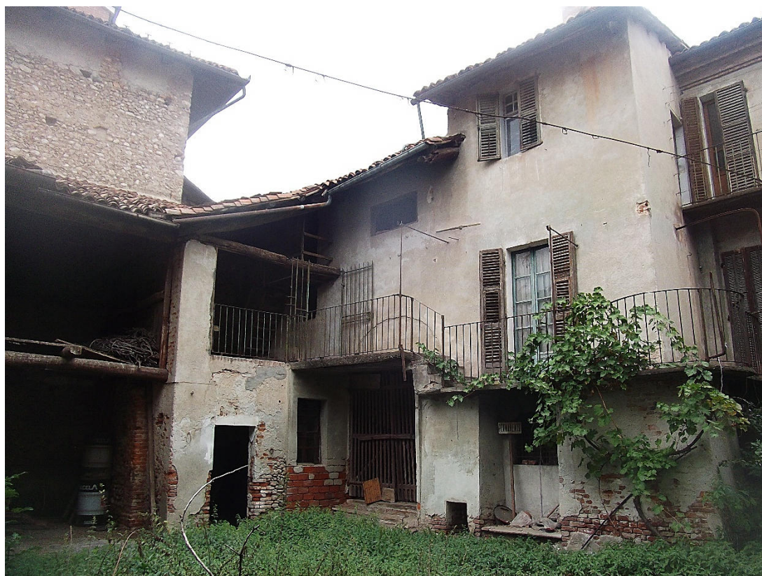
FIGURA 10 VISTA FOTOGRAFICA 8 (VERSO INTERNO CORTILE)