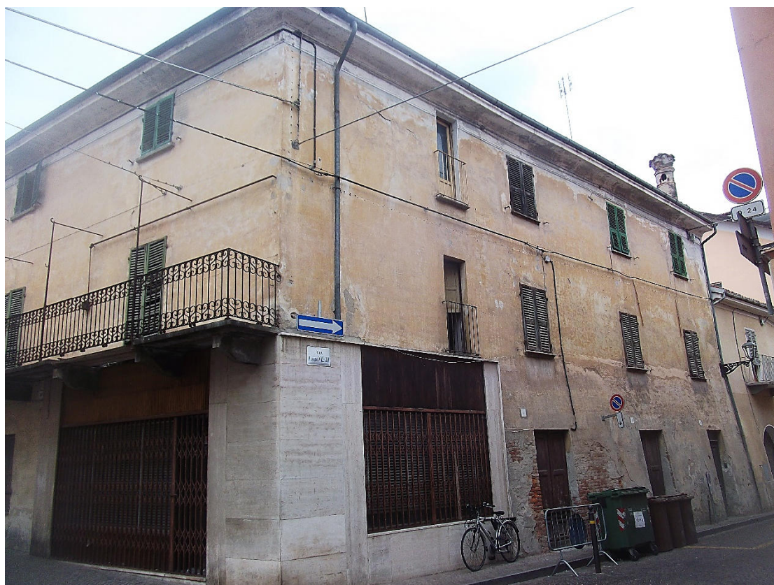
FIGURA 3 VISTA FOTOGRAFICA 2 (ANGOLO VIA MASSIMO D'AZEGLIO E VIA UMBERTO I)