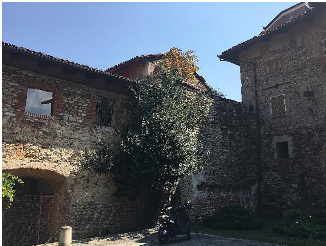
FIGURA 7 VISTA FOTOGRAFICA 5 (VERSO CORTILE CONDOMINIO "ANNUNZIATA")