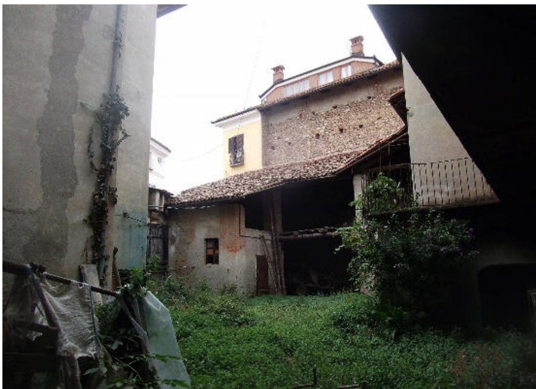
FIGURA 8 VISTA FOTOGRAFICA 6 (VERSO INTERNO CORTILE)