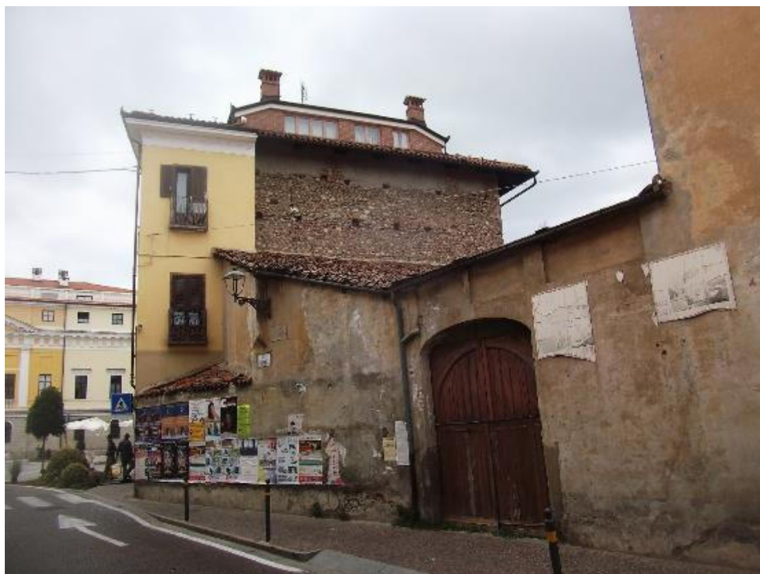
FIGURA 6 VISTA FOTOGRAFICA 4 (VERSO VIA UMBERTO I)