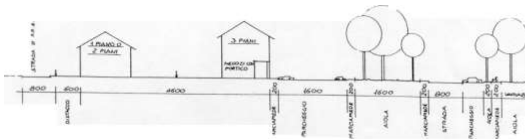
Schema piazza e viale verso il Campo Sportivo