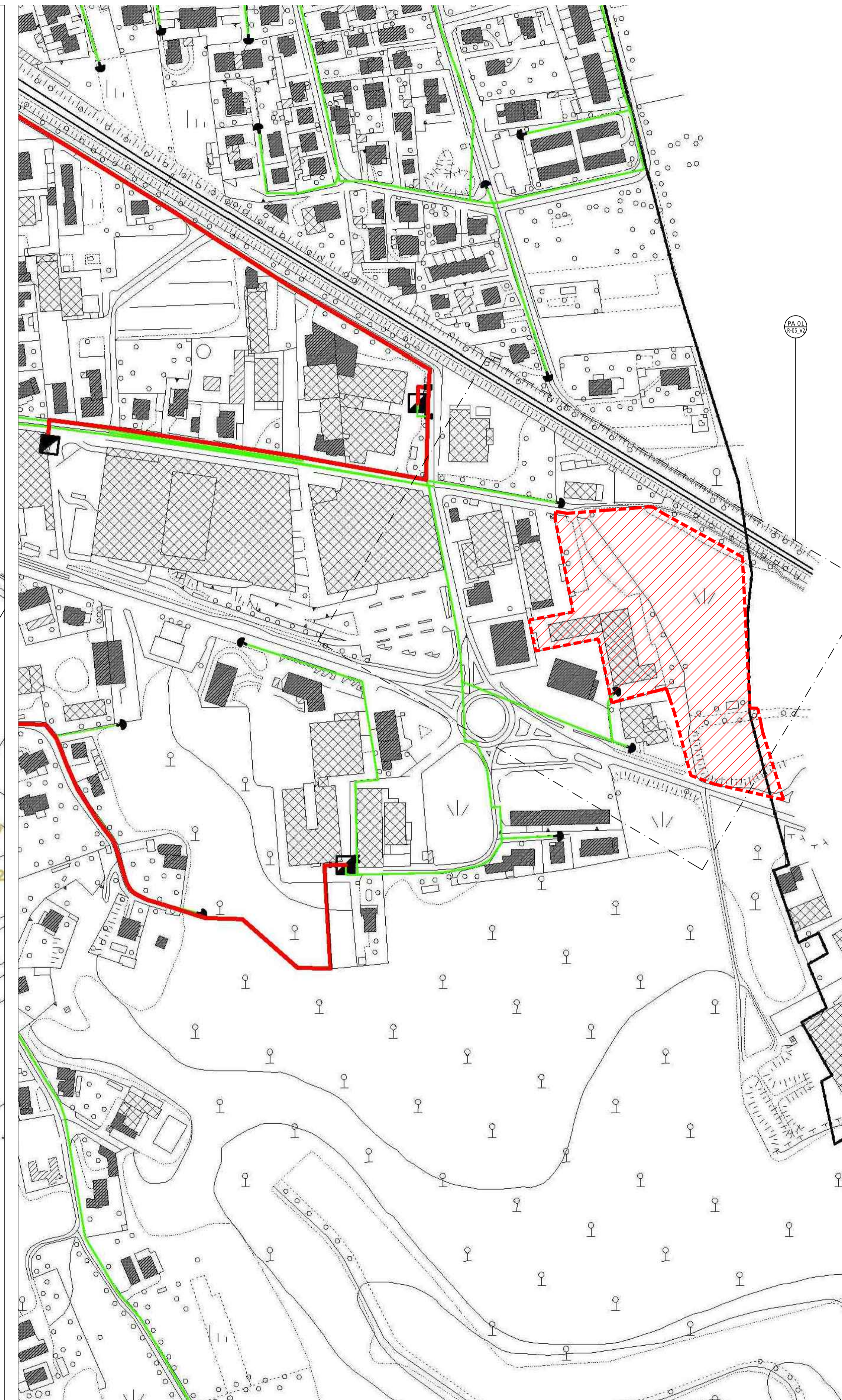
Area metanizzata - elaborato rilevato presso l'U.T.C. - LL.PP. del comune di Somma Lombardo Sovrapposizione del perimetro della proposta di Piano Attuativo