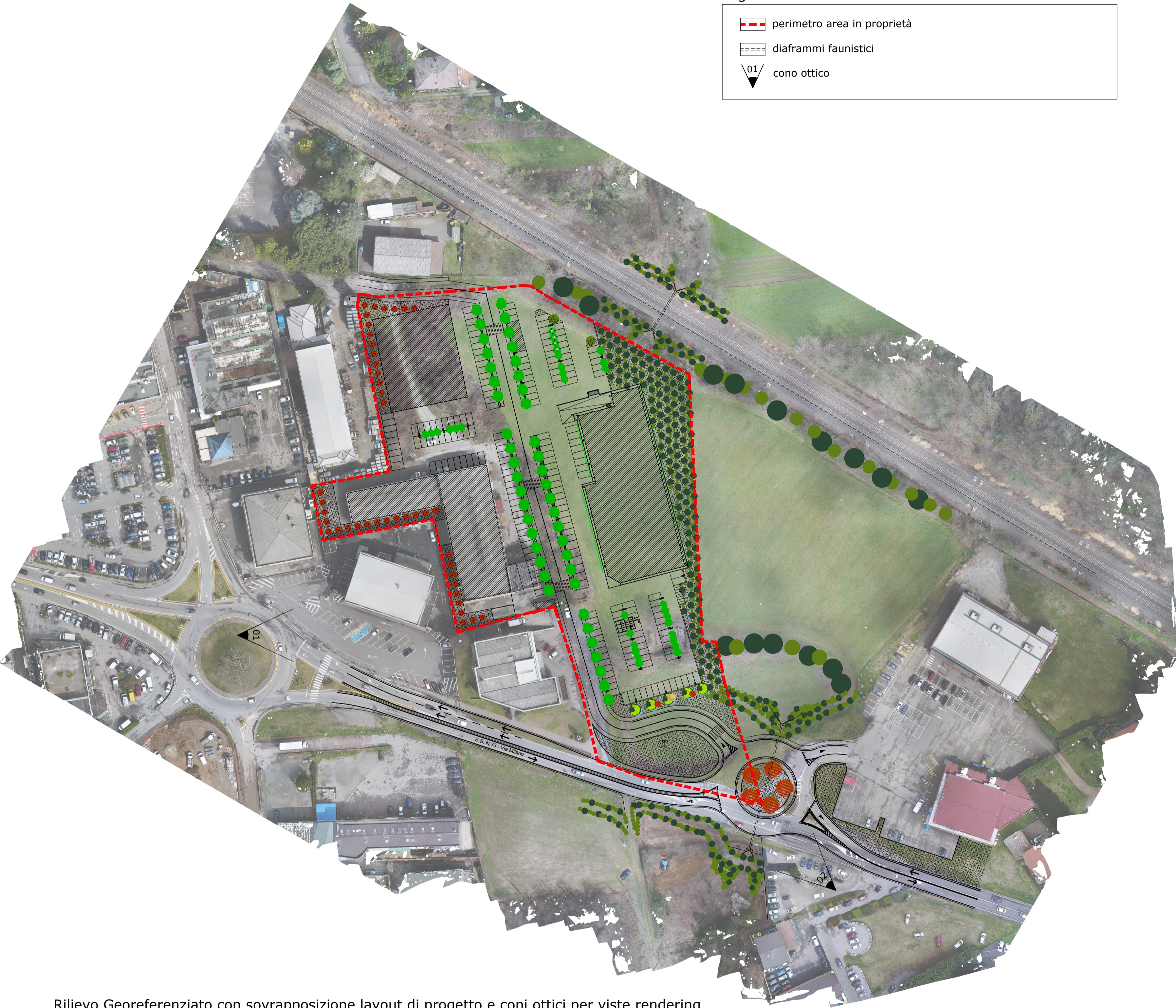
Rilievo Georeferenziato con sovrapposizione layout di progetto e coni ottici per viste rendering