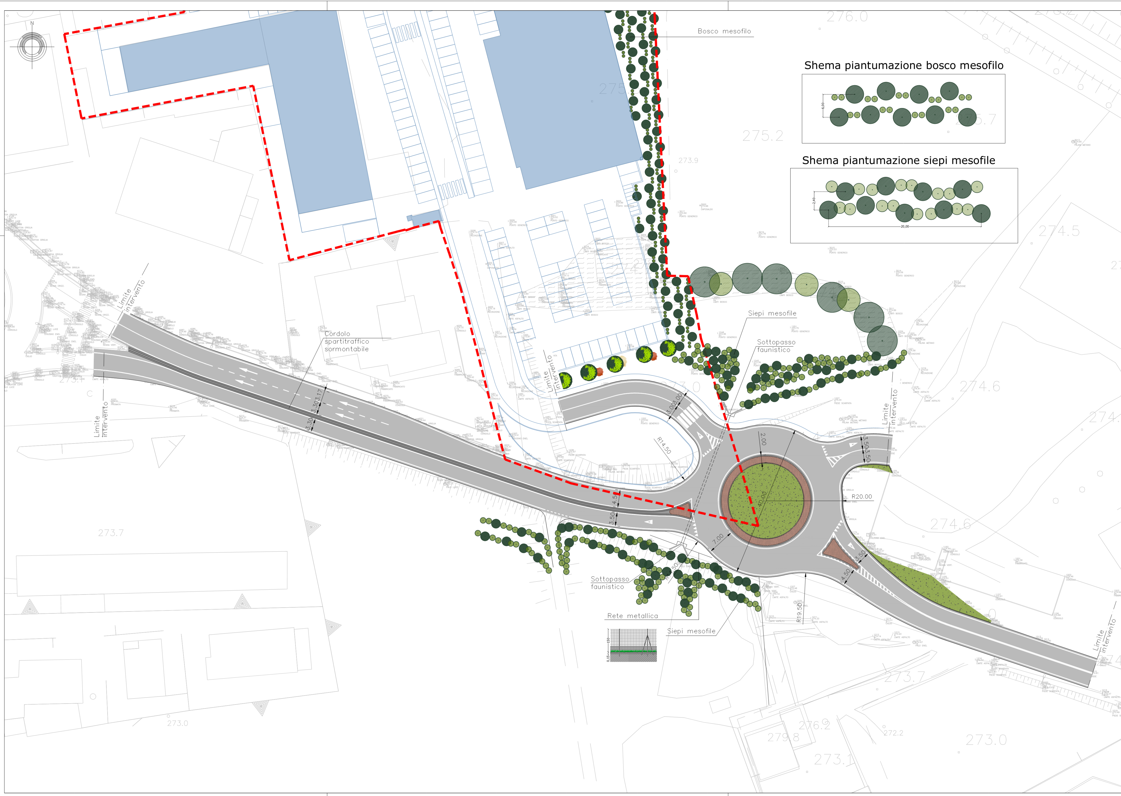
Schema piantumazione bosco mesofilo