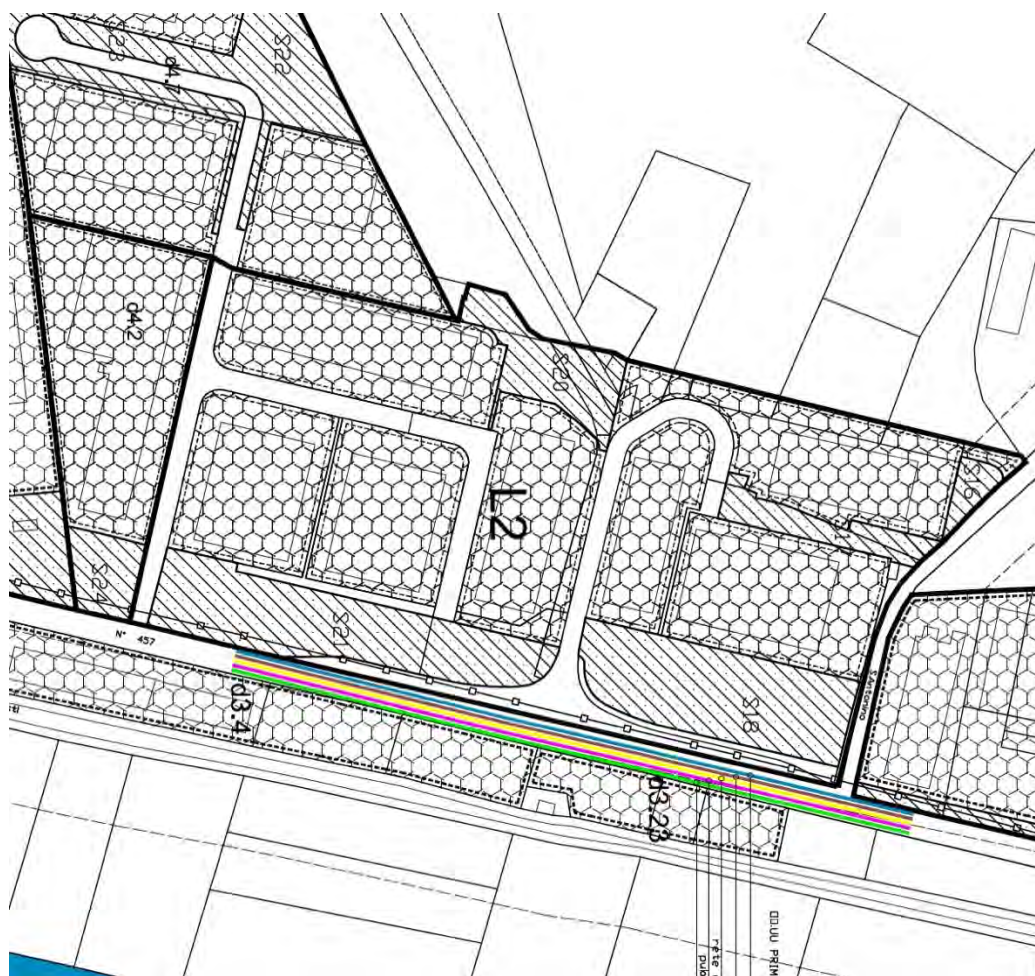
Stralcio tavola in variante

In seguito ad una specifica richiesta per la creazione di una superficie espositiva per il noleggio e la vendita di autovetture viene individuata una nuova AREA DI RIORDINO E COMPLETAMENTO INFRASTRUTTURALE A PREVALENTE DESTINAZIONE PRODUTTIVA d3.23 confinante con l'esistente area d.3.4.