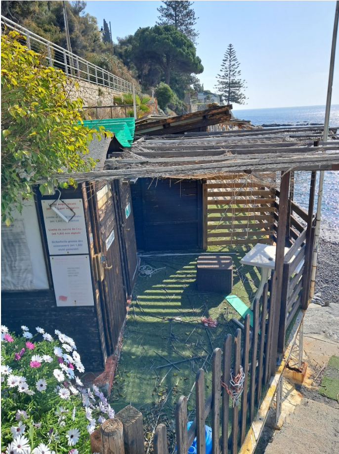
VISTE DEL MODELLO