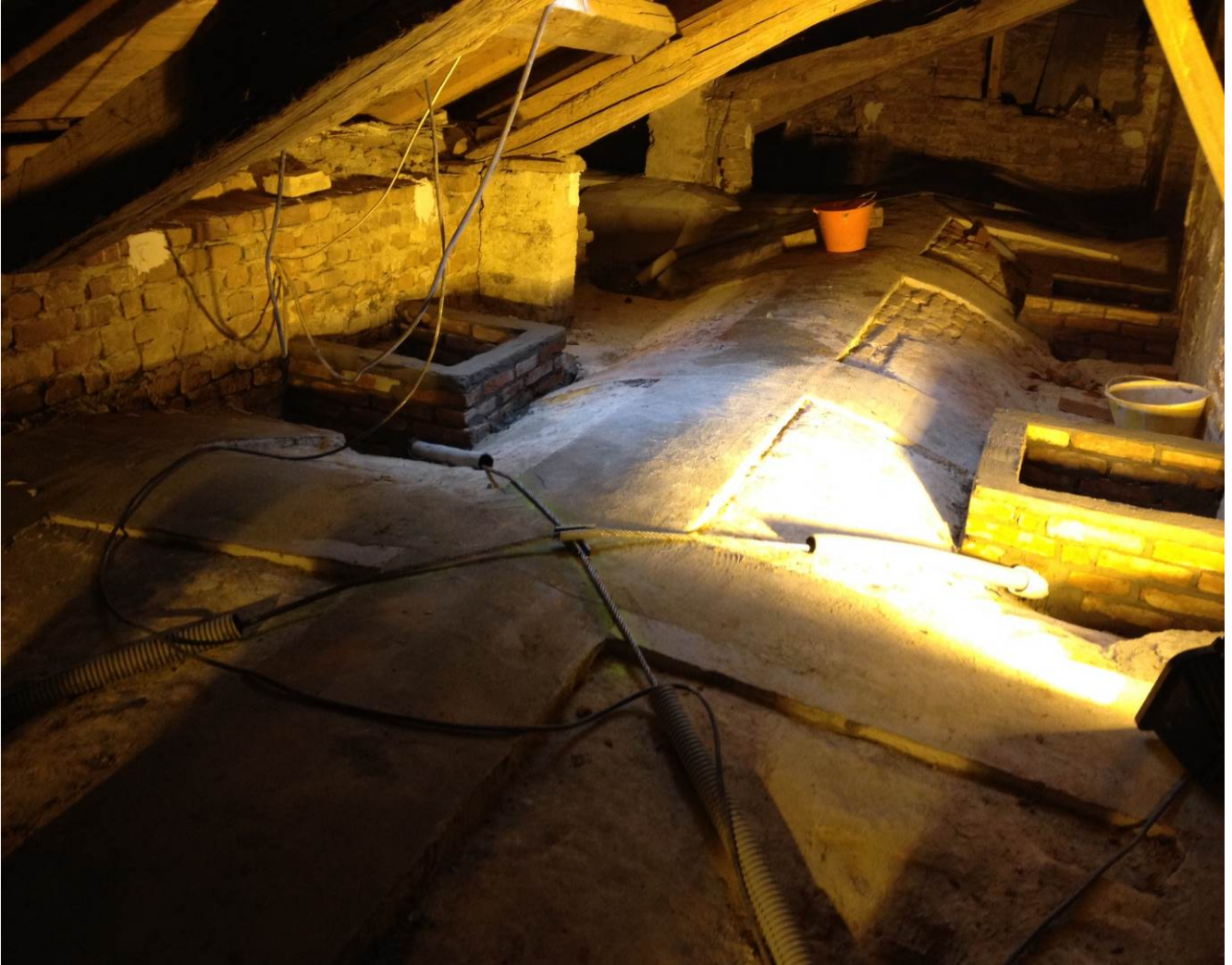
Foto n°2 – consolidamento estradossale delle volte a corciera con la tecnica del carbonio e dei cavi di compressione in armature a trefolo

Fase di preparazione del piano di applicazione del carbonio lungo le generatrici delle volte e di posa dei cavi in acciaio a trefolo continuo