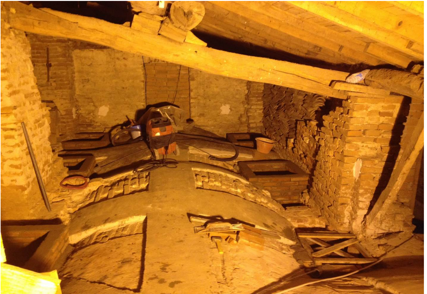
Foto n°1 – consolidamento estradossale delle volte a botte con la tecnica del carbonio

Fase di preparazione del piano di applicazione del carbonio lungo le generatrici delle volte