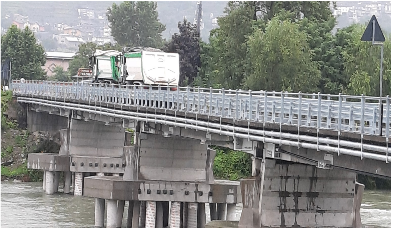
Foto n° 1 Ponte sul fiume Adda Prova di carico per redazione del Collaudo statico