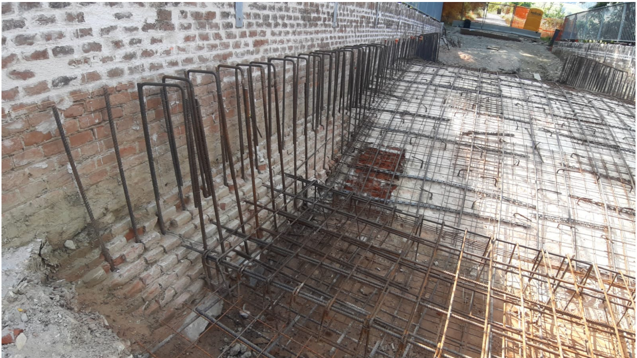
Foto n°1 – Intervento di rinforzo cappa strutturale arco impalcato