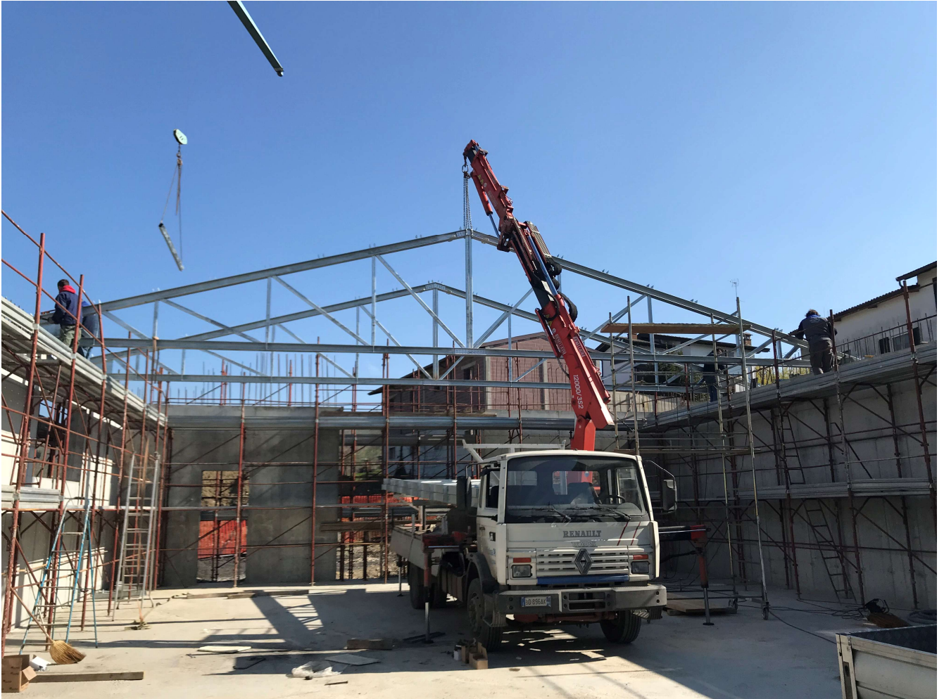
Foto n° 1 Montaggio in opera di capriata metallica avente luce L=16,00 mt

4. REALIZZAZIONE DI CAPANNONE AD USO COMMERCIALE/AGRICOLA CON COPERTURA IN ELEMENTI STRUTTURALI IN ACCIAIO – CAPRIATA METALLICA DI LUCE PARI A L= 16,00MT (PROGETTISTA E DIRETTORE DELLE OPERE STRUTTURALI IN CEMENTO ARMATO ED ACCIAIO).