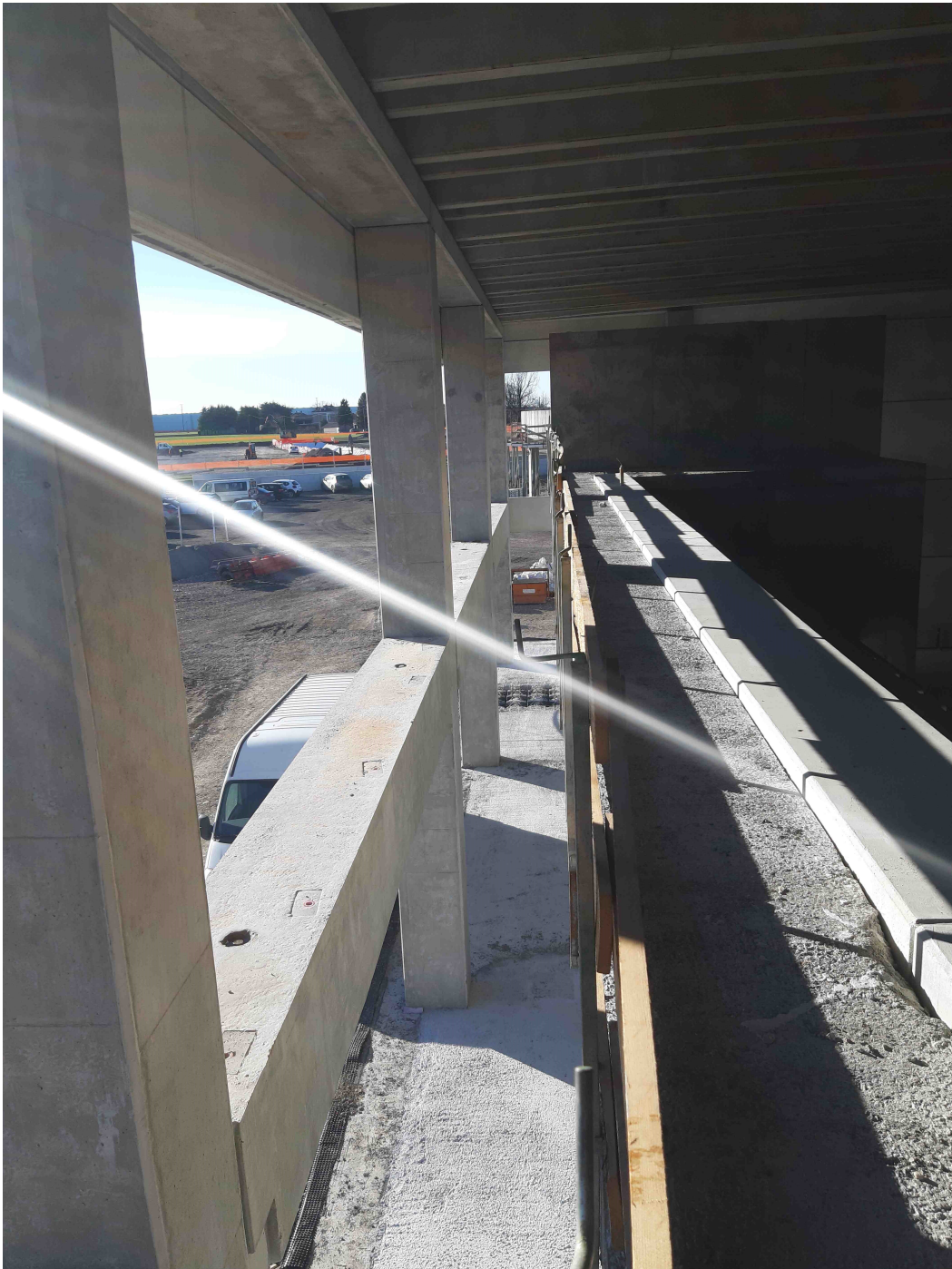
Foto n° 3 Opere strutturali edificio Lotto n°1 – Cittadella dello Sport