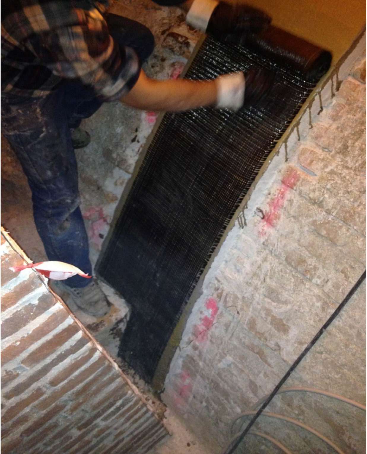
Foto n° 5 - consolidamento estradossale delle volte a corciera con la tecnica del carbonio, stesa delle matrici di carbonio di tipo bi-direzionale