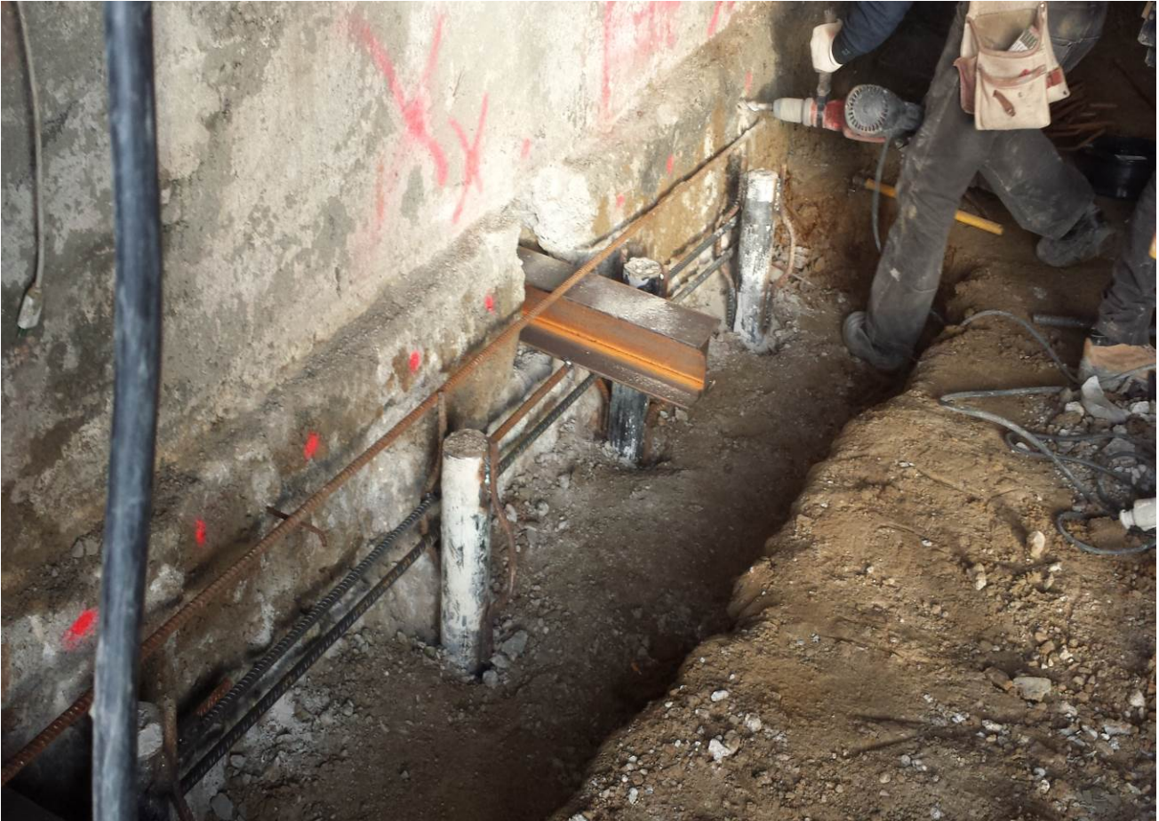
Foto n° 1 – Intervento di consolidamento delle fondazioni esistenti mediante fondazioni indirette micropali e putrelle a moncone