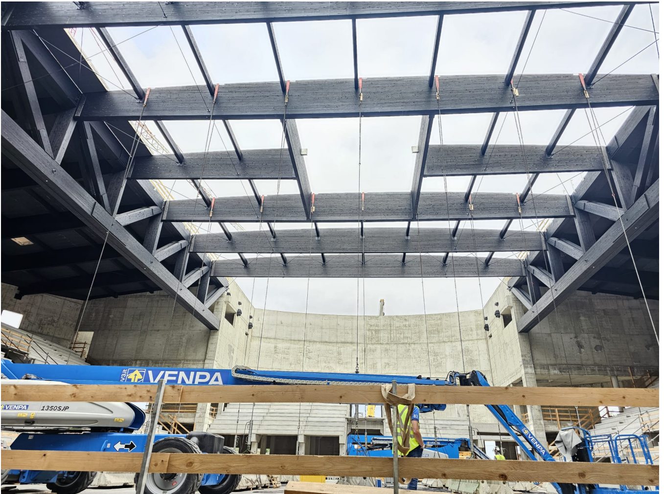
Foto n° 4 Prova di carico della copertura in legno lamellare travi – reticolari: lunghezza L= 45,00ml altezza h= 6,00ml.