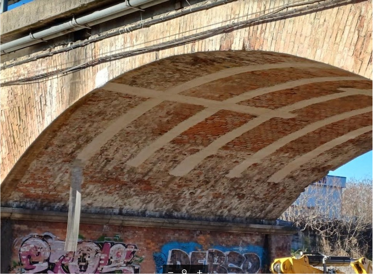
Foto n°2 – intervento di rinforzo arcata n°3 – con fasciature in carbonio/geosteel