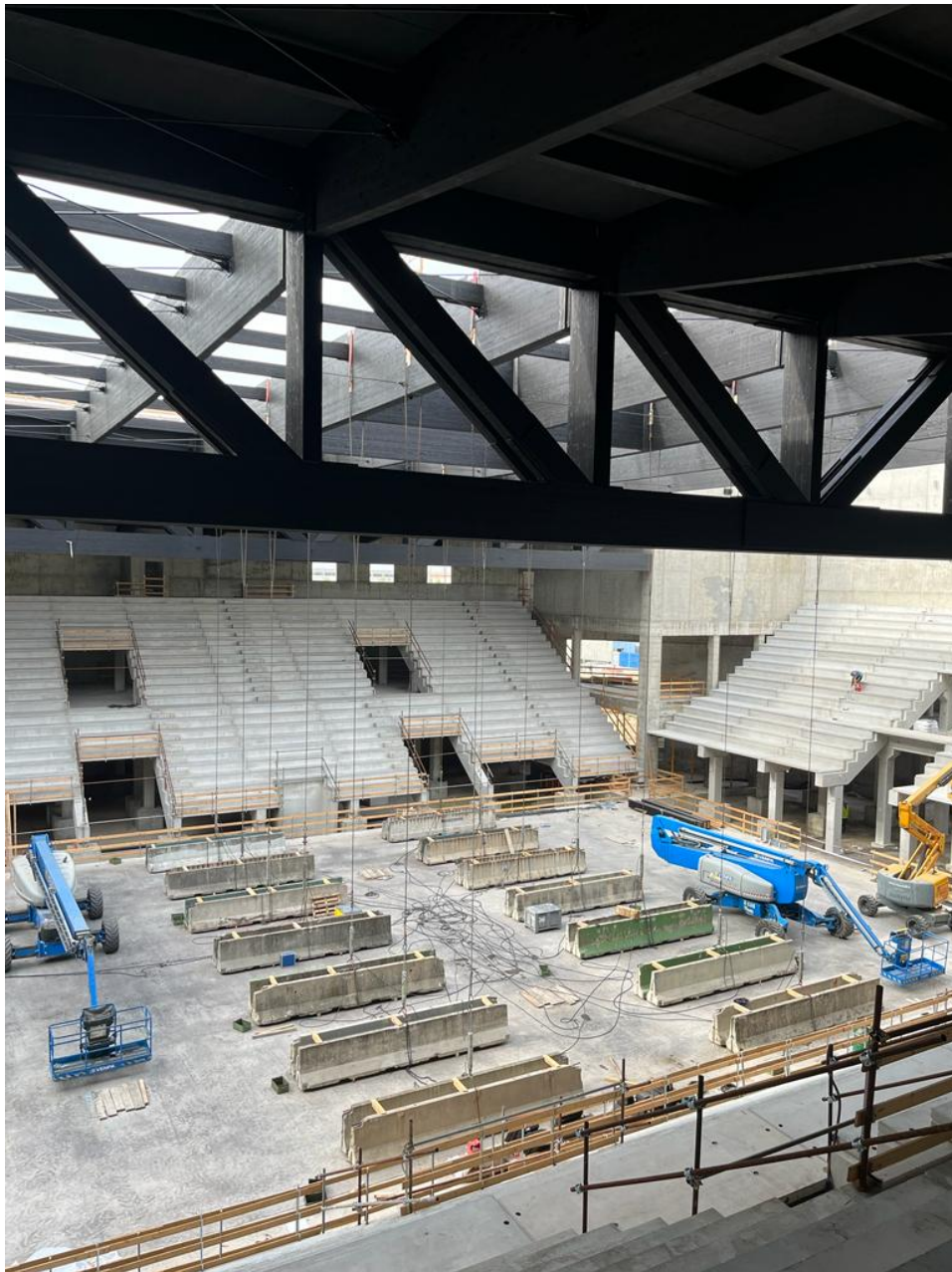
Foto n° 5 Prova di carico della copertura in legno lamellare travi – reticolari: lunghezza L = 45,00\text{ml} altezza h = 6,00\text{ml} .