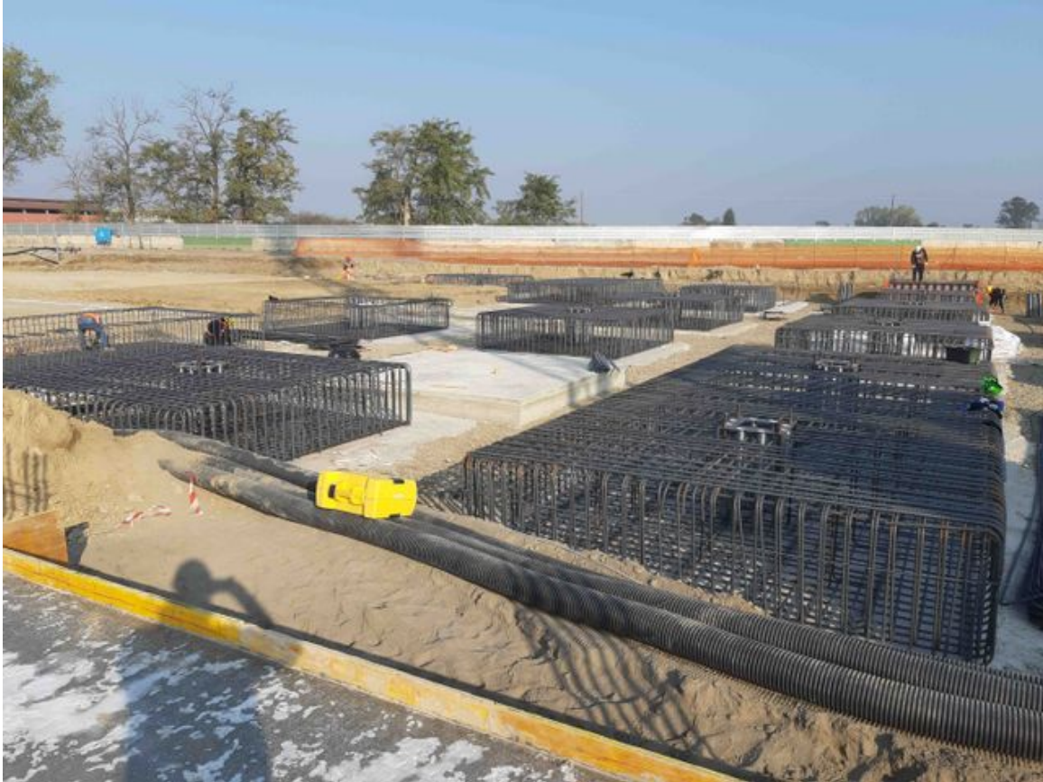
Foto n° 2 Opere strutturali di fondazione edificio Lotto n°1 – Cittadella dello Sport