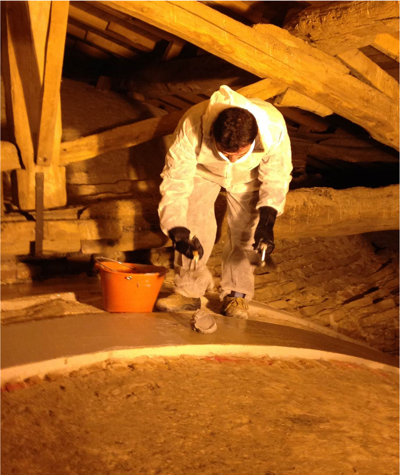
Foto n° 3 - consolidamento estradossale delle volte a corciera con la tecnica del carbonio, stesa delle matrici di carbonio di tipo bi-direzionale