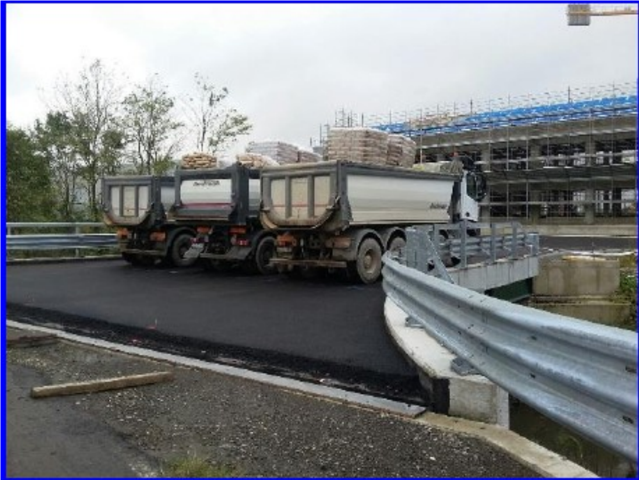
Foto n° 1 Ponte Roggia grande Bolognini Prova di carico per redazione del Collaudo statico

PONTE SULLA ROGGIA GRANDE BOLOGNINI PER RACCORDO STRADA PROVINCIALE S.P.412 (EXS.S.412) E STABILIMENTO DITTA UGOLINI – campata unica luce l=16,50 ml.