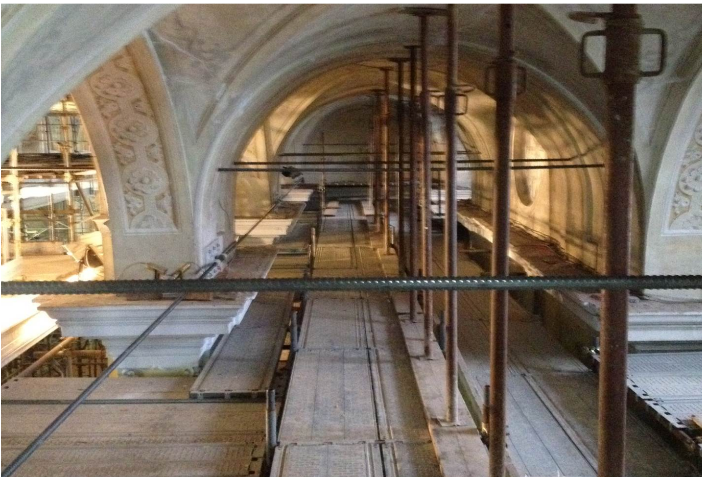
Foto n° 6 – n°7 Intervento di tirantatura con barre diwidad ad alta resistenza a trazione nelle zone intradossali delle volte a crociera - navate laterali