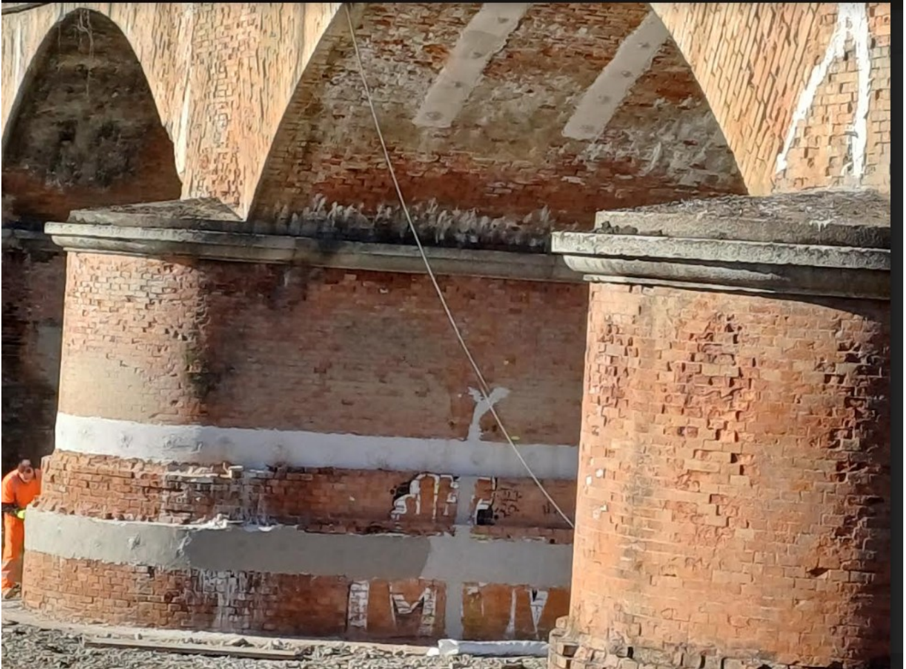
Foto n°1 – intervento di rinforzo della pila n°2 con fasciature in carbonio/geosteel