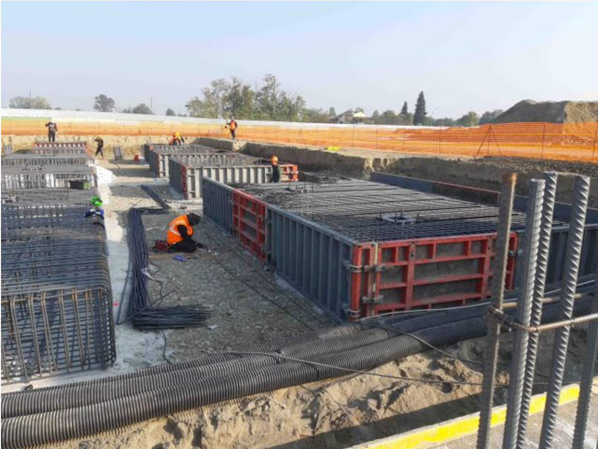
Foto n° 1 Opere strutturali di fondazione edificio Lotto n°1 – Cittadella dello Sport