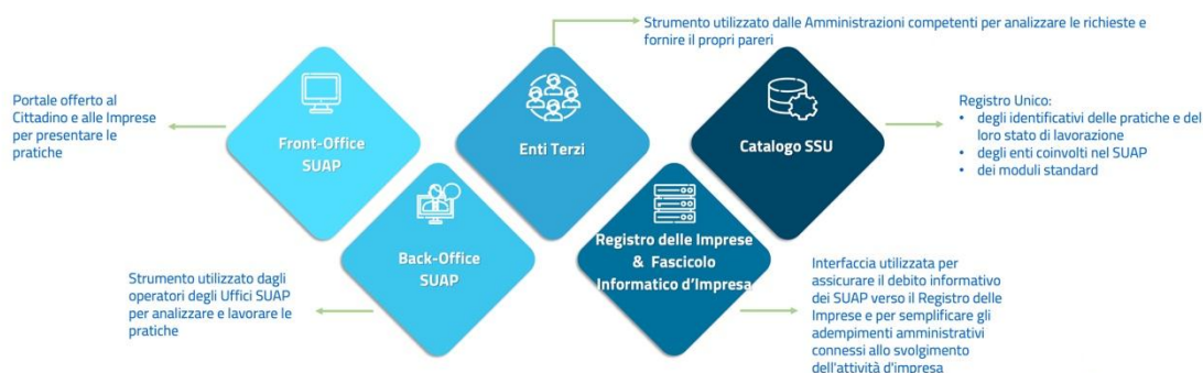
Schema esemplificativo della nuova architettura di gestione del SUAP

Gli interventi riflettono le specifiche tecniche previste nel nuovo allegato al DPR. 160/2010 , redatte dal Gruppo Tecnico istituito dal Dipartimento della Funzione Pubblica (DFP) e dal Ministero delle imprese e del made in Italy (MIMIT), coerentemente con le Linee Guida emanate da AgID in attuazione dell'articolo 71 del Decreto Legislativo 7 marzo 2005, n. 82 e s.m.i. ed approvate in Conferenza Unificata con decreto n.275 del 25 settembre 2023.