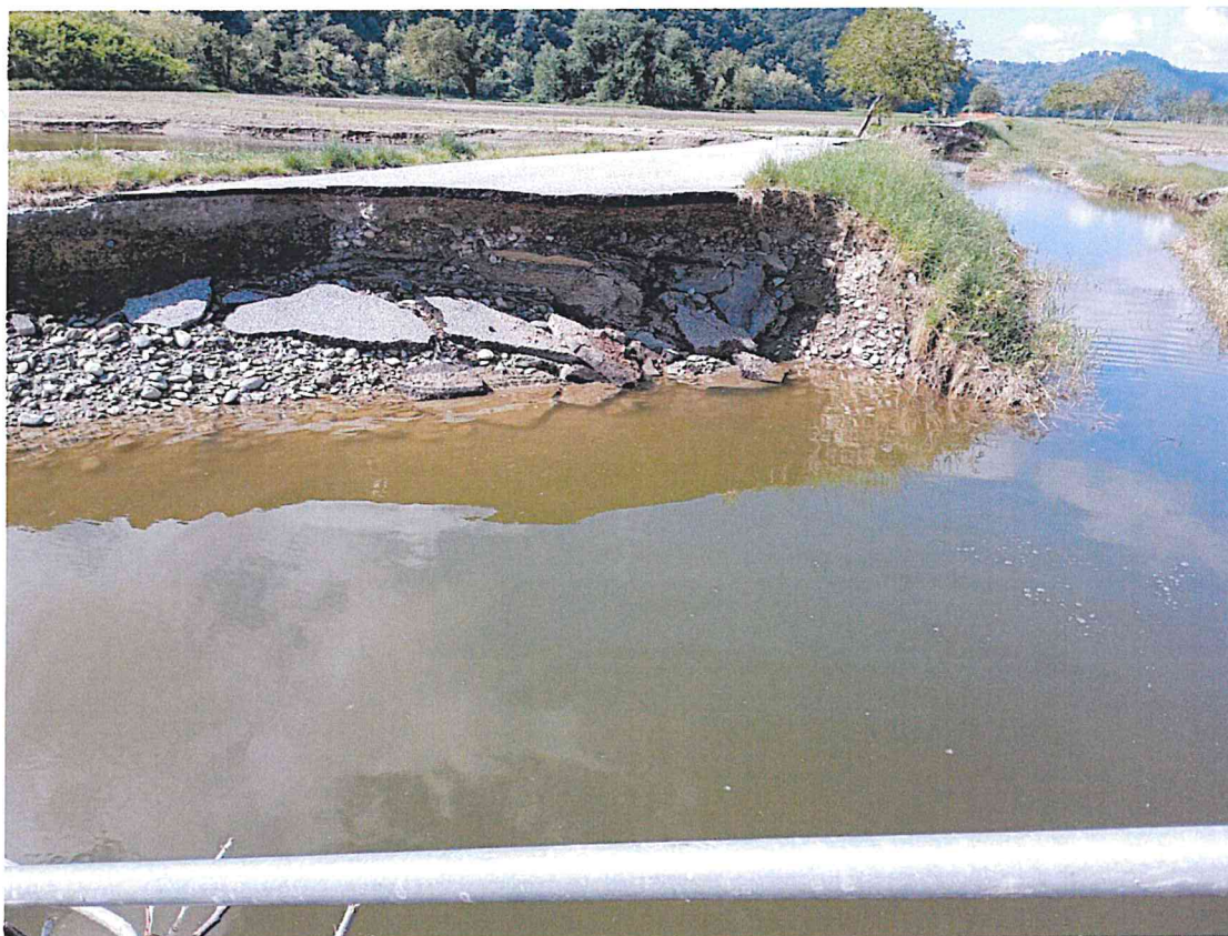
DETTAGLIO ACQUE STAGNANTI

Naviglio oggetto di intervento di ripristino sezione costeggiante strada comunale