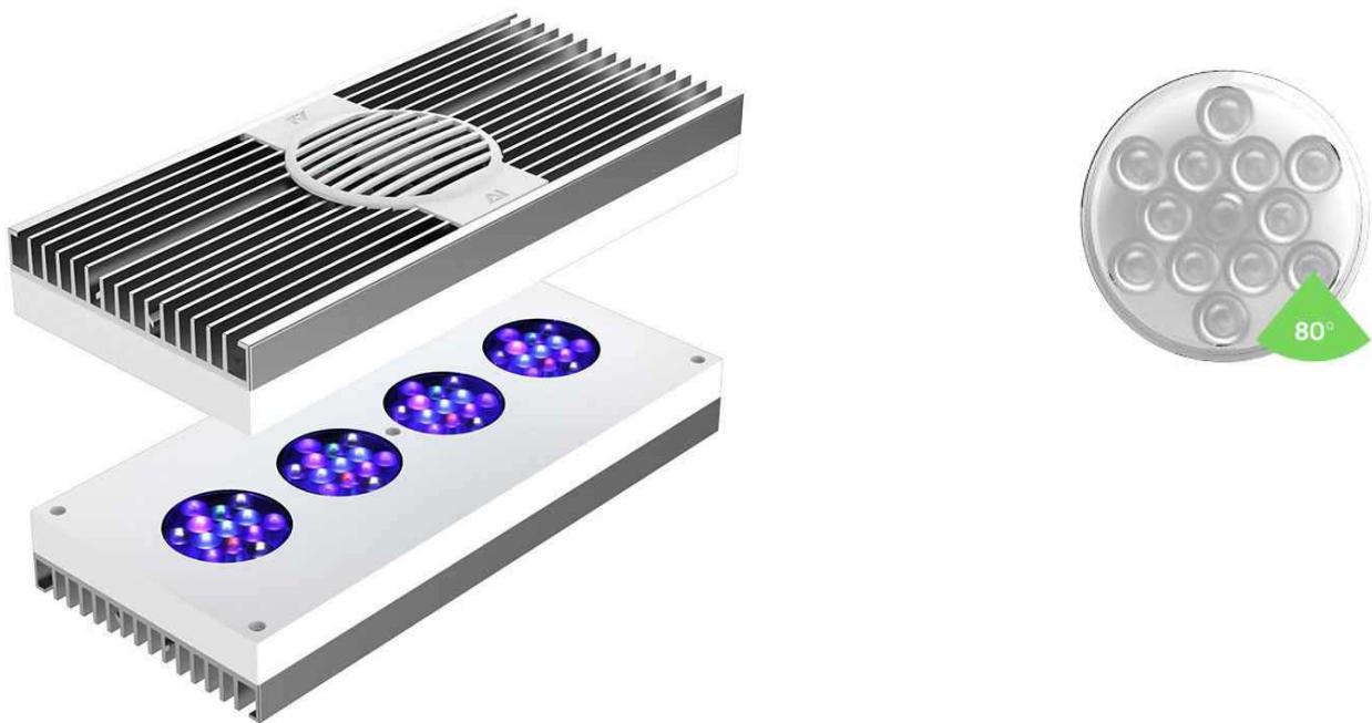
Immagine indicativa della plafoniera LED a 4 cluster con dettaglio dell'angolo di diffusione del fascio luminoso a 80°

Nello svolgimento del servizio è richiesta la reperibilità telefonica 7 giorni su 7 con intervento entro le 8 ore in caso di guasti o malfunzionamenti.