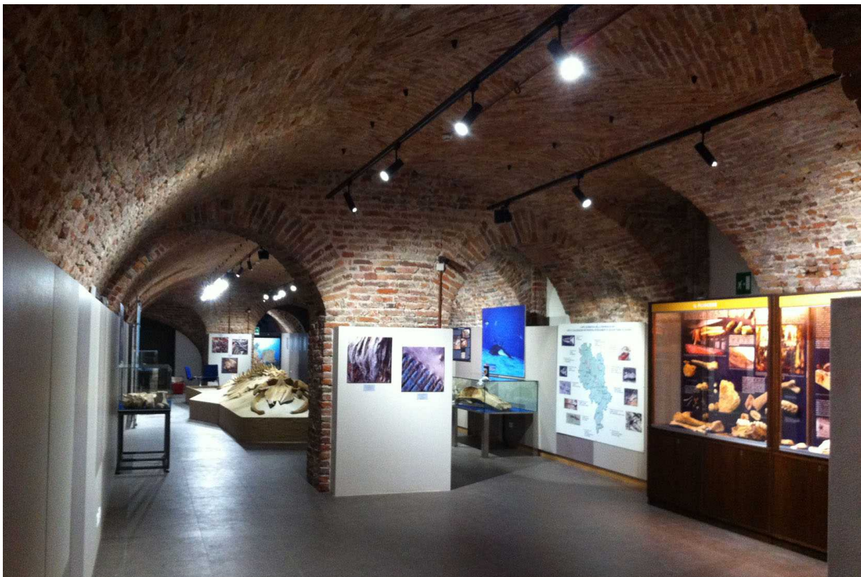
La sala principale del Museo con gli allestimenti provvisori vista dal lato ingresso – l'acquario è in fondo, non visibile oltre l'ultima arcata.

L'area espositiva attuale è costituita da un unico grande locale di circa mq 320 di cui mq 265 circa sono aperti al pubblico e i rimanenti sono dedicati agli impianti tecnologici e a magazzino. A questi si aggiunge la saletta all'ingresso e i locali dei servizi e impianto tecnico dell'acquario marino di barriera, al fondo verso l'uscita.