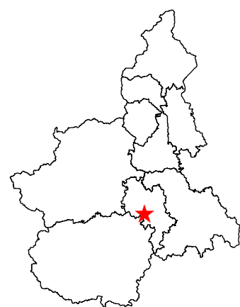
Inquadramento sezioni CTR 1:10.000