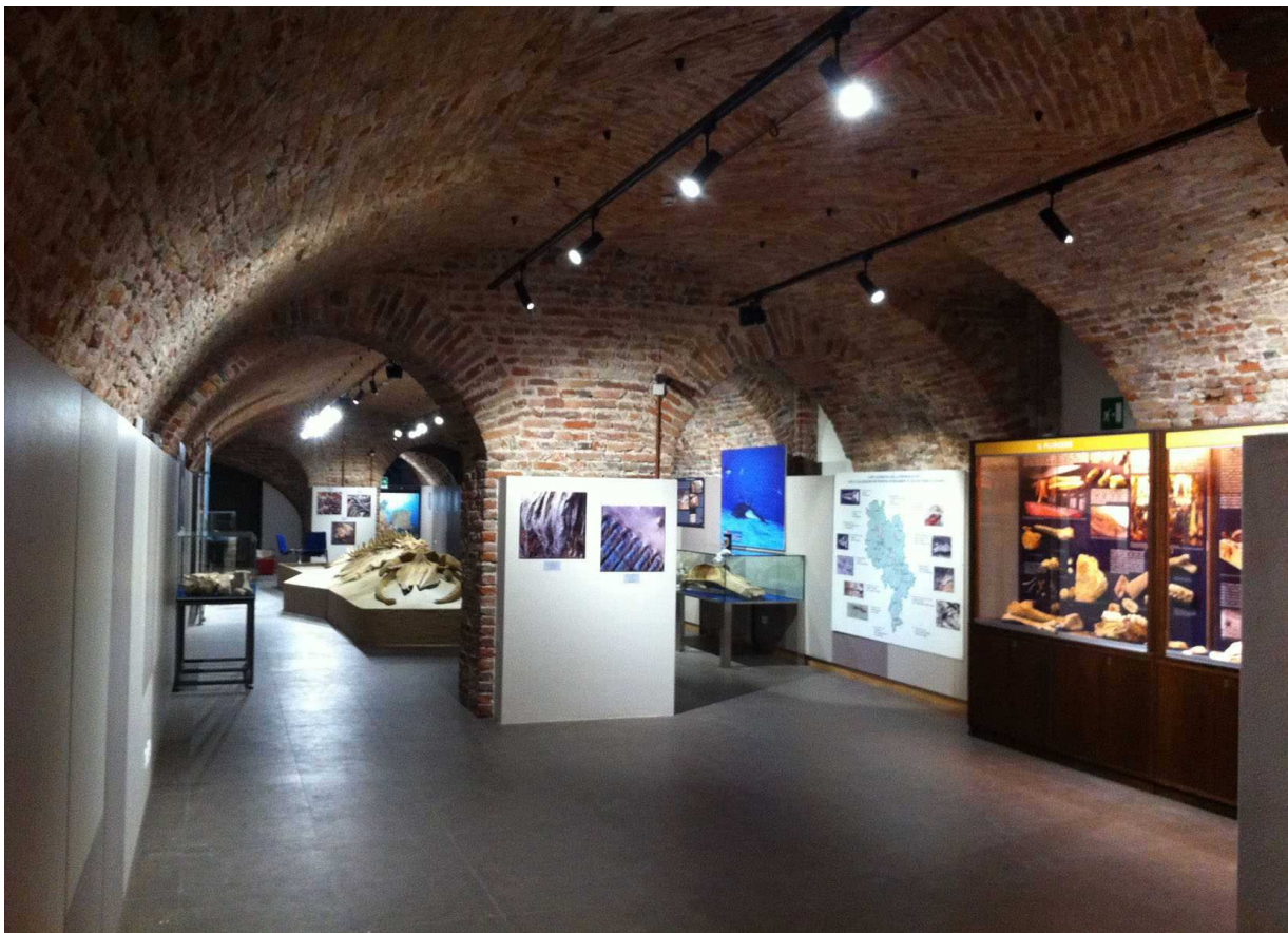
La sala principale del Museo con gli allestimenti provvisori vista dal lato ingresso – l'acquario è in fondo, non visibile oltre l'ultima arcata.

L'area espositiva attuale è costituita da un unico grande locale di circa mq 320 di cui mq 265 circa sono aperti al pubblico e i rimanenti sono dedicati agli impianti tecnologici e a magazzino. A questi si aggiunge la saletta all'ingresso e i locali dei servizi e impianto tecnico dell'acquario marino di barriera, al fondo verso l'uscita.