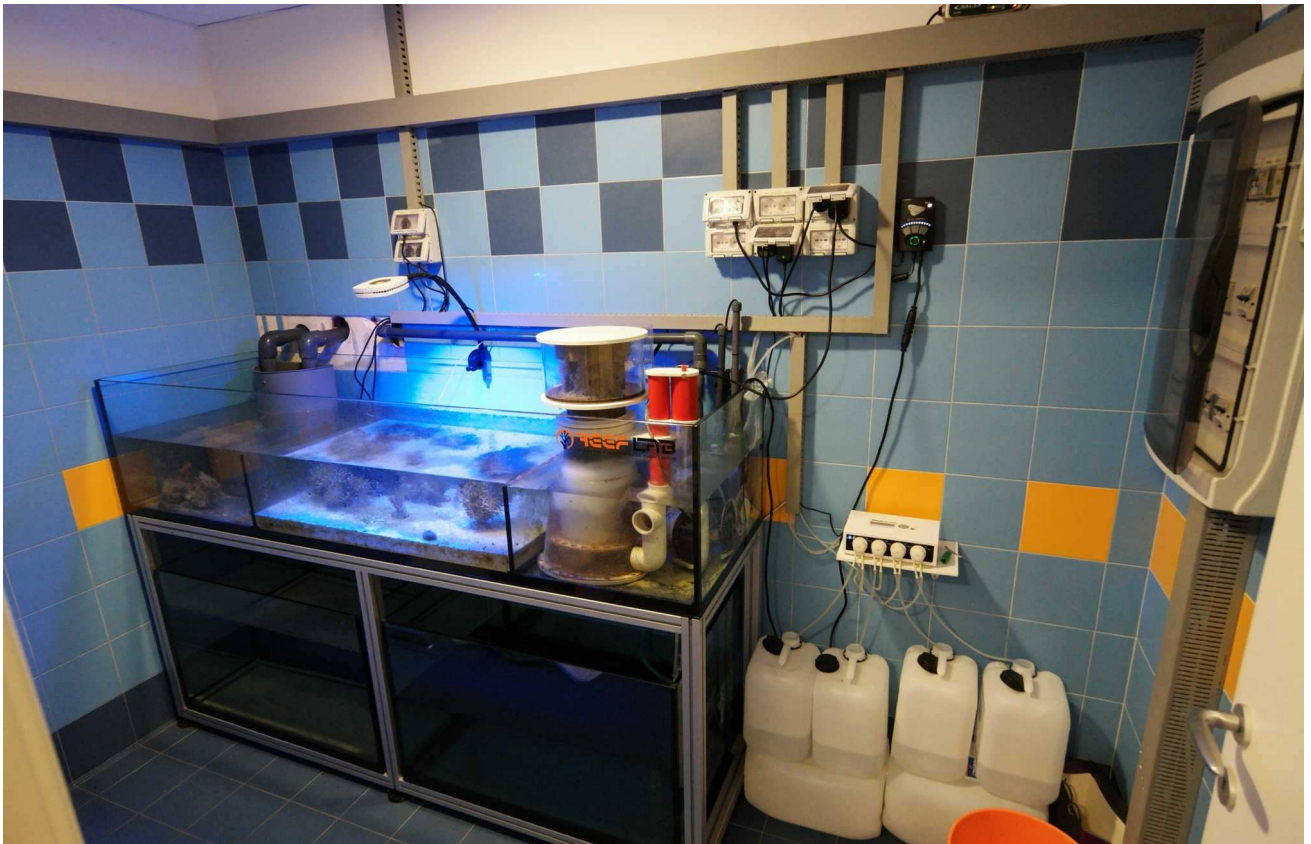
Locale dedicato agli impianti: a destra il quadro elettrico principale, a sinistra, non visibile, di fronte alla Sump, l'impianto di produzione acqua osmotica.