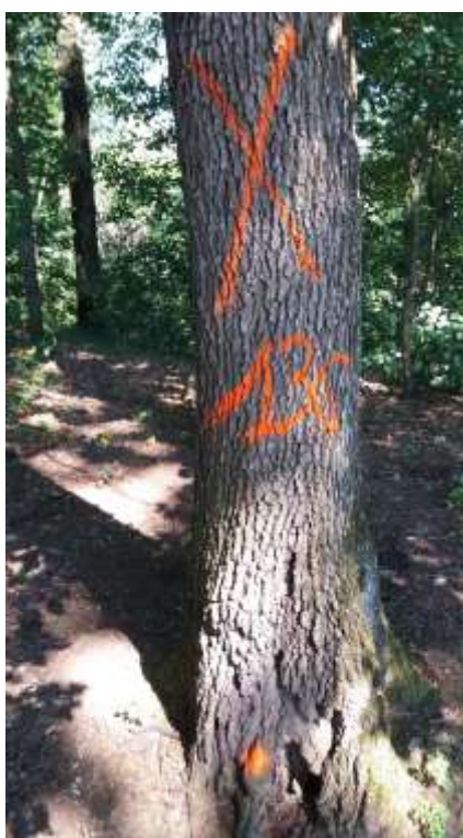
Dettaglio di esemplare con carie in atto nei pressi della Casa Parco assegnato al taglio

Per quanto riguarda il Parco Naturale di Rocchetta Tanaro, si riscontra un numero elevato di esemplari quercini che presentano condizioni fitosanitarie mediocri e pessime per via del deperimento dei popolamenti caratterizzati soprattutto da una struttura monoplana con età avanzata dei singoli soggetti. Alcuni di essi, ormai deperienti sono interessati da patologie fungine e più raramente da attacchi di insetti che ne limitano fortemente la stabilità. I patogeni fungini sono spesso agenti di carie o di marciume radicale, appartengono a varie specie anche se quelli più diffusi sono l'armillaria ed il Ganoderma lucidum . Anche la robinia, soprattutto in assenza di interventi di ceduzione recenti si presenta deperiente e oggetto di attacco da parte di patogeni fungini con esemplari ormai morti o fortemente instabili.