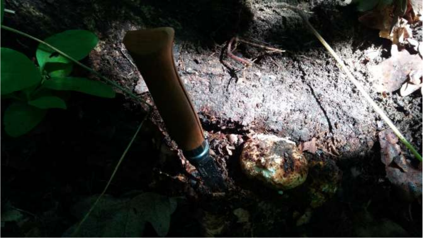
Carpofori di fungo cariogeno Polyporus sp