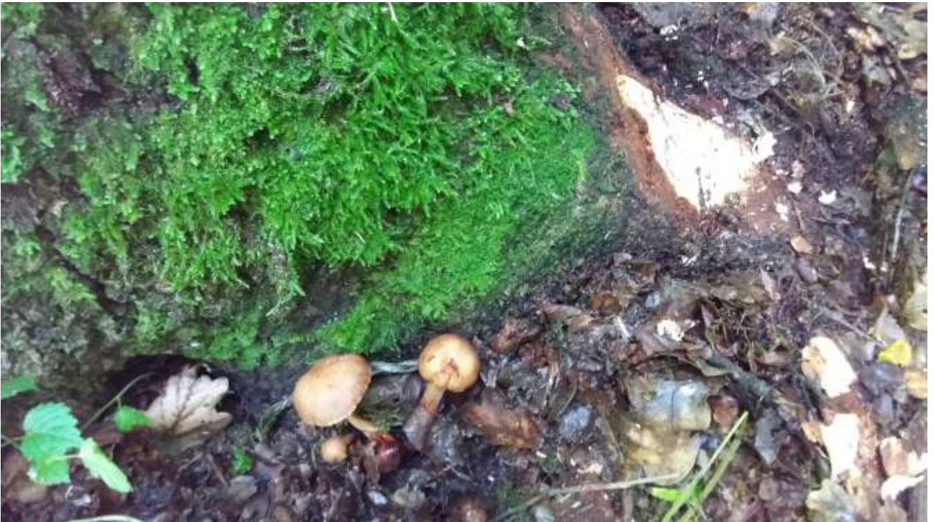
Carpofori di armillaria, cavità e specchiatura di albero da abbattere