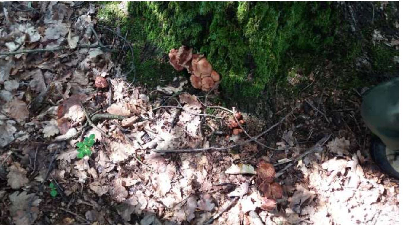
Dettaglio di carpofori di armillaria