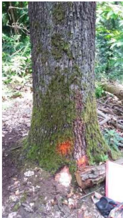
Dettaglio di specchiatura durante assegno al taglio di esemplare da abbattere