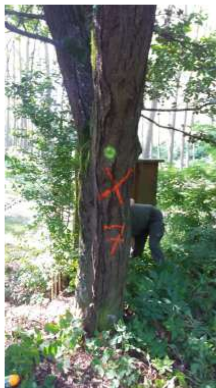
Area di sosta Tre Vescovi e Val Sarmassa con assegnazione al taglio di esemplari con problematiche.