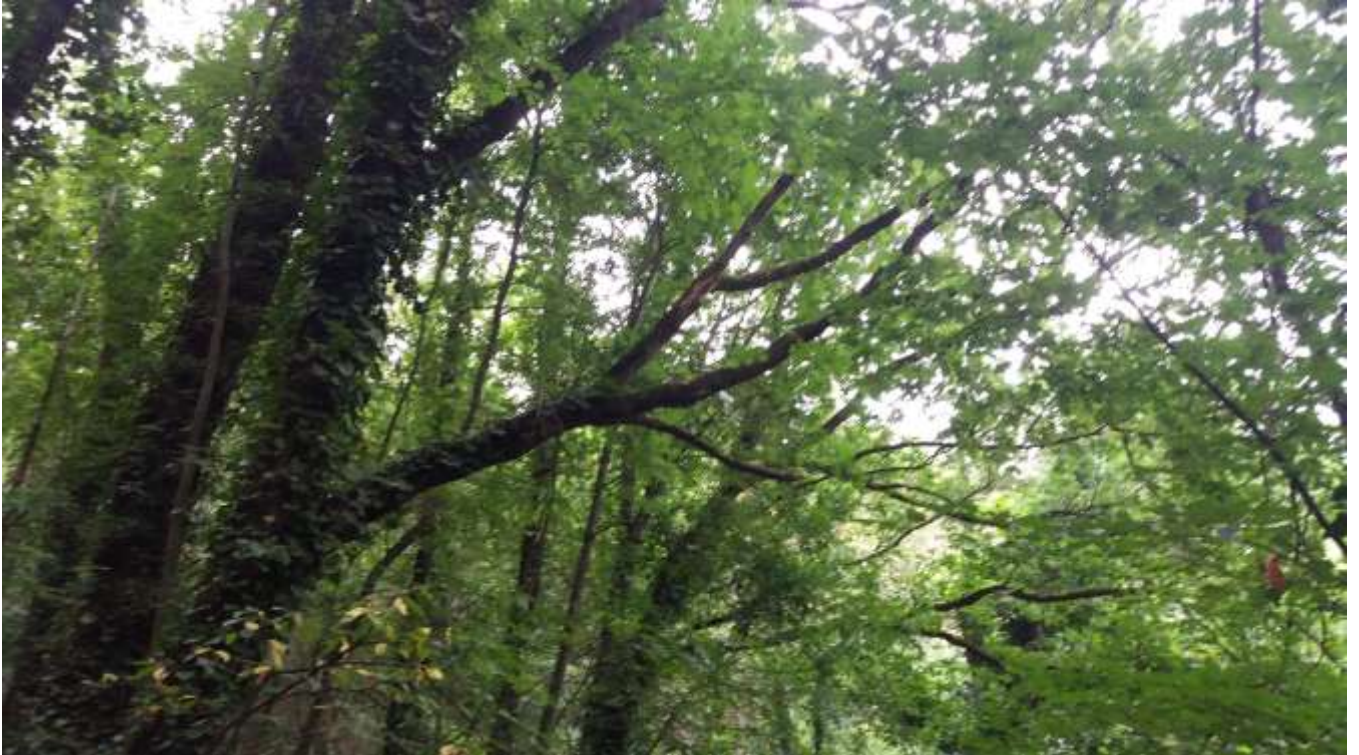
Dettaglio di esemplari da assoggettare a rimonda del secco