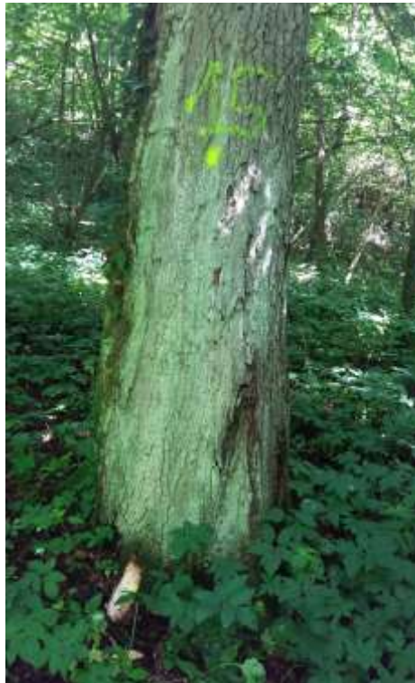
Dettaglio di specchiatura e numerazione durante assegno al taglio di esemplare da abbattere (sentiero Rabengo)

Nel corso delle valutazioni per gli esemplari da potare e da ricontrollare è stato preso punto GPS, ai fini di una corretta e successiva individuazione. Ai fini di adempiere a quanto previsto dal Regolamento Forestale Regionale, gli esemplari aventi diametro ad 1,30 m d'altezza superiore ai 27,5 cm sono stati assegnati al taglio con martellata alla base su apposita specchiatura con martello forestale numero AT 101 A e numerazione progressiva anche sul fusto; quelli appartenenti alle classi comprese tra 17,5 e 27,5 cm sono stati assegnati con bollo di vernice sul fusto ed al piede. Quest'ultima risulta rossa per gli alberi di nuovo abbattimento compresi in tutte le aree di sosta e sentieri tranne che per il Rabengo (lettera F) per il quale è in colore giallo. Per quanto riguarda i numeri sulle specchiature, essi sono progressivi e partono da 0 per il sentiero Rabengo mentre seguono l'ultimo numero di martellata precedente sia per la Val Sarmassa che per il Parco di Rocchetta.